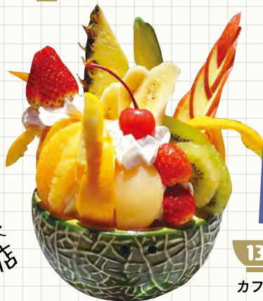
13 カフェ・チェリー