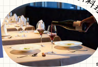
14 she-Bop TERRACE