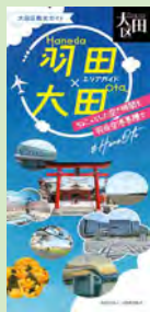
羽田×大田 エリアガイド

東京・大田区には羽田や蒲田をはじめ、観光、グルメ、銭湯など魅力的なスポットが満載! この冊子はダイジェスト版。もう少し詳しくご覧になりたい方は各デジタルブックをcheck!