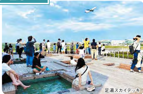
足湯スカイデッキ

羽田イノベーションシティ内にあり羽田 空港や離発着する飛行機を眺めながら 足湯につかれるスポット