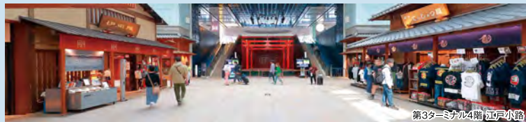
第3ターミナル4階 江戸小路