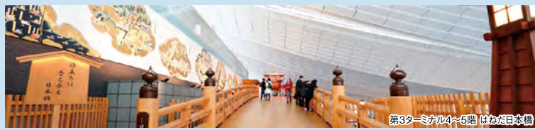
第3ターミナル4～5階 はねだ日本橋