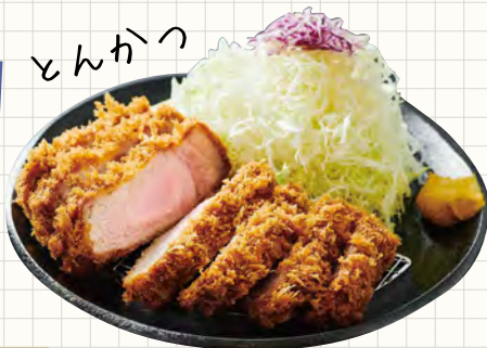
11 とんかつ憶(あおき)蒲田本店