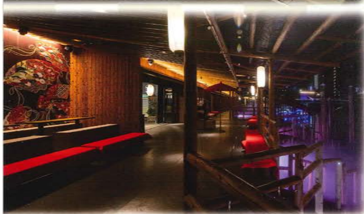
乗船までのひとときをゆったりとお過ごしいただける待合所