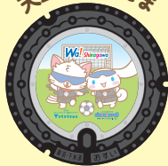
天王洲やたまたま