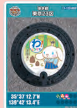
武蔵小山たけのこ