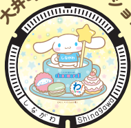
大井町イルミネーション