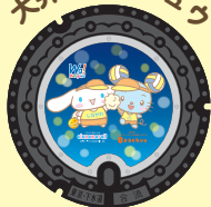
大井町ビーチユウ