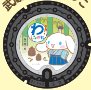
武蔵小山たけのこ