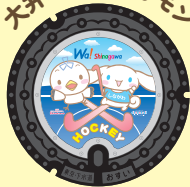
大井ふ頭シナカモン