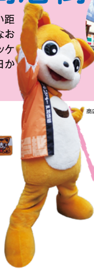
商店街のキャラクター・戸越銀座次郎(銀ちゃん)