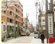
品川宿場通り南会