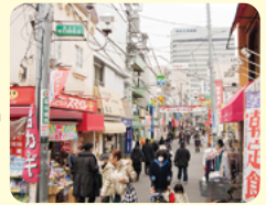
旗の台東口通り商店街