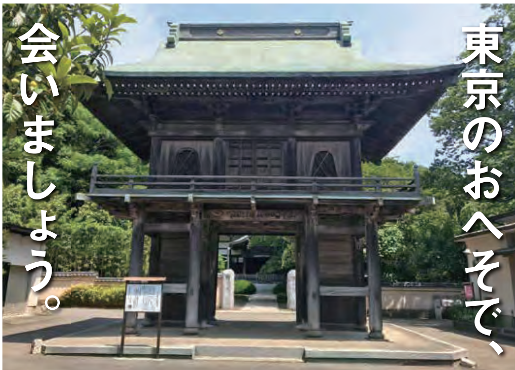
国分寺楼門（市重要有形文化財） [拡大図 map c-2]