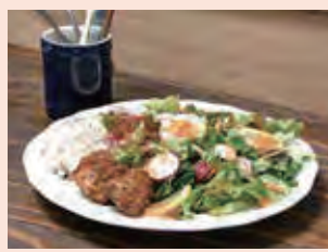
こくベジプレート