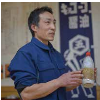
しょうゆの材料を見せながら作り方を説明

めんつゆ、ドレッシングなどしょうゆ加工品を多数販売。新商品に、あきる野市の友好都市大島町のとうがらしをキッコーゴ醤油に漬けた「大島とうがらし醤油」がある。刺身につけて食べると美味。