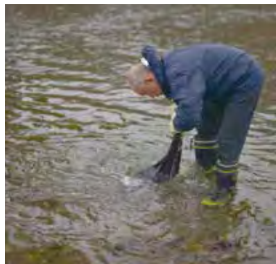
秋川の冷たい水に染めた糸をさらす

いもので20回以上繰り返し染め返す。なんども染めた絹糸はからみやすく、最初のうちは扱いに手間どった。生産性は上がらず、コースターのような小さな製品しか作れなかった。だが、ここ数年の生産量