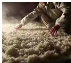
こしきで蒸した米を外気に当て冷却する

長い間、岩手から来る杜氏の下で技術を修得し、平成27（2015）年より杜氏となる