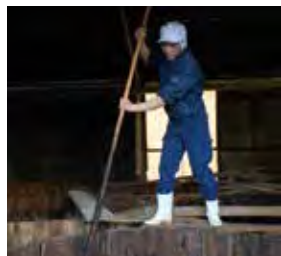
木桶を攪拌して発酵を促す

国産の大豆と小麦で造った麹を仕込み、1年かけてじっくり発酵・熟成させる。100年以上使い続ける木桶にすみついた微生物の働きで豊かな風味と深い味わいが生まれ、琥珀色のきれいなしょうゆに仕上がる。