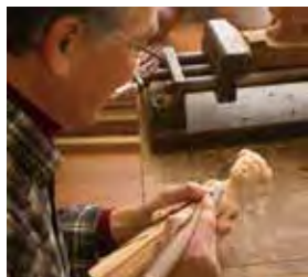
様々な刃物を駆使して製作する

『ものをつくる人は枠にはまっちゃいけない』と言われた。海外での経験が、人まねでない自由な作風の土台となった。