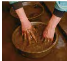
鉄分の多い土を媒染に使う

黒八丈はヤシャブシの実を煮出して染料にし、泥に含まれる鉄分で媒染することから「泥染め」と呼ばれる。繰り返し染め重ねるうちに黒に深みが増し、照りが出て粋な風合いの「ツヤ