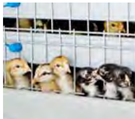
ヒナから育てられる「東京しゃも」

現在、都内で2か所のみとなった、東京しゃも生産養鶏場のひとつで、ヒナ（雛）を含め東京しゃも5000羽のほか採卵鶏4000羽を飼養している。養鶏場へは自宅（青梅）からの通いが、ほとんどは実家養鶏