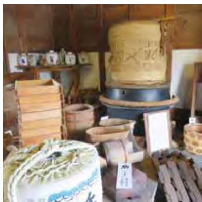
敷地内にある酒造り資料館