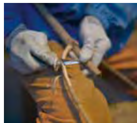
小刀で器用に木の皮をむく

からで、真剣に鍛冶屋になろうと思った時期もあった。小刀の「肥後守」をポケットに入れて常に持ち歩き、弓矢など遊び道具を作るのに使っていた。小学校の家庭科の授業で、クラスでただ一人リンゴの皮をナイフできれいにむき、「5」をもらったこともある。いまだに小刀で鉛筆を削らないと落ち着かないとも。タモ網作りの名人は、それ以前に刃物研ぎの名人であった。暮らしを楽しむ術を知っている人で、金継ぎや洋菓子作りもかなりの腕前。