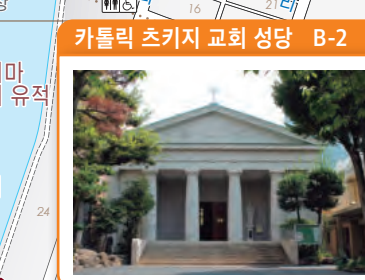
카톨릭 츠키지 교회 성당 B-2