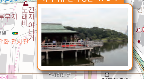
하마리큐 온시 정원 A-B-4