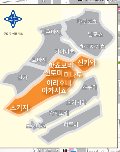
주요 관광 정보 센터