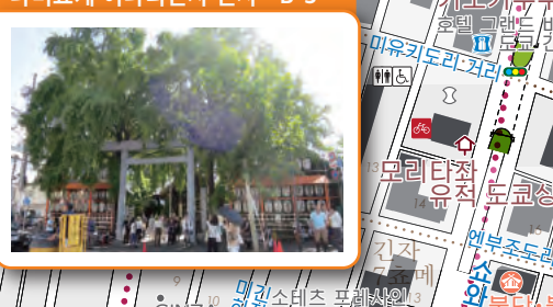
나미요케 아나리진자 신사 B-3