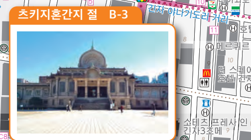
츠키지혼간지 절 B-3