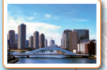
에이타이 다리 C-1