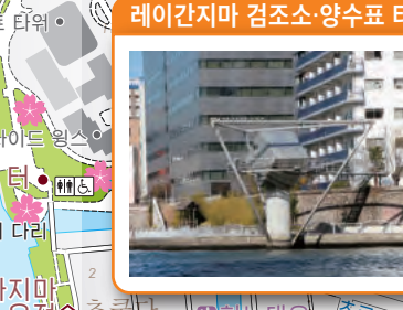
레이간지마 검조소·양수표 터 C-1