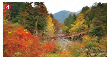
石舟橋を渡って瀬音の湯へ