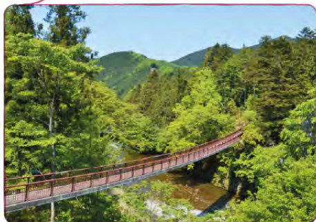
秋川溪谷のシンボル。 橋からは、新緑や 紅葉など四季折々に 変化する溪谷美が 楽しめる。