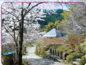
白梅や山野草の咲く山間の禅寺。 境内の横を流れる養沢川には蛍が舞う。