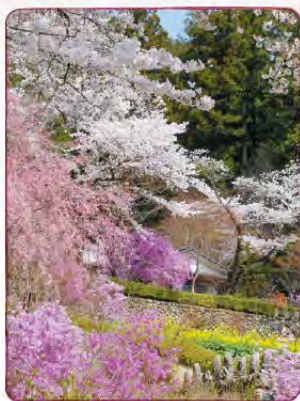
春にはシダレザクラやミツバツツジ などで付近一帯がピンク色に 包まれ、幻想的な姿に。