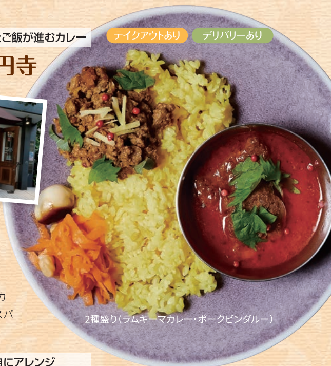
2種盛り(ラムキーマカレー・ポークビンダルー)