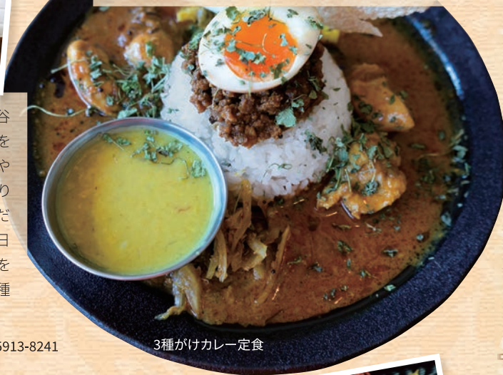
3種がけカレー定食