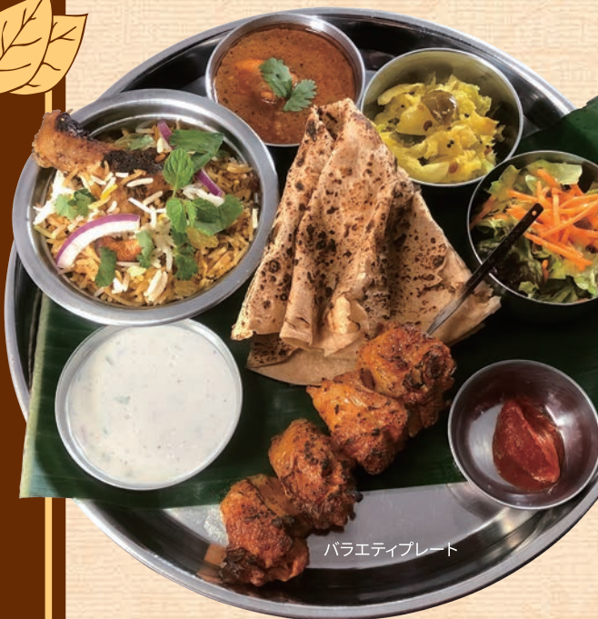
バラエティプレート