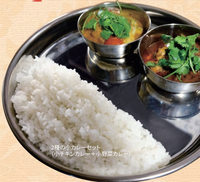
2種の小カレーセット (小チキンカレー+小野菜カレー)