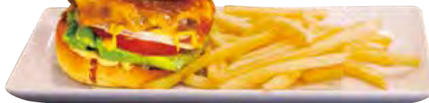
ハングリーヘブンチーズ