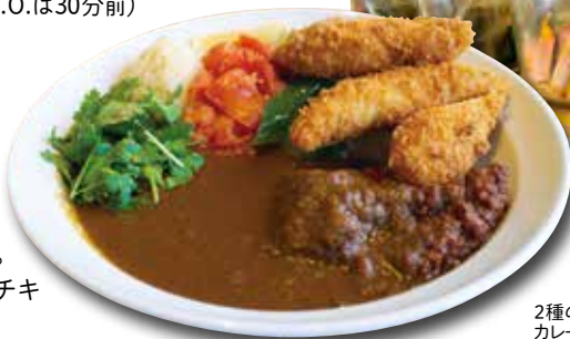
2種の カレー チキンかつ

玉ねぎをじっくり炒めて作るブラウンオニオンカレーは、濃厚な味わいが特徴です。2種類のカレーと彩り鮮やかな野菜の付け合わせが基本スタイル。トッピングはボリューム満点のチキンかつがおすすすめです。