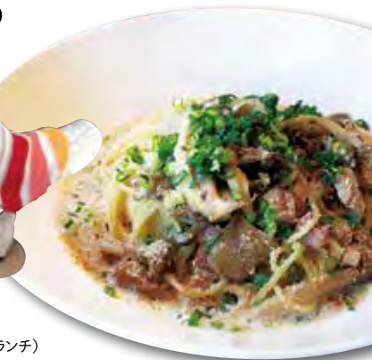
日替わりランチ(パスタランチ)