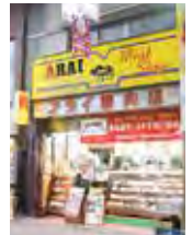
チーズアボカドサンド

昭和11年創業の老舗精肉店。国内産にこだわったお肉と揚げ物が購入できます。定番はコロッケ、メンチカツ。地元の方はもちろん、著名人が差し入れとしても選ぶ人気商品。食べ歩きにもおすすめです。