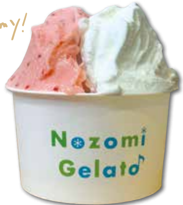
ジェラート(こだわりいちご・のぞみのミルク)