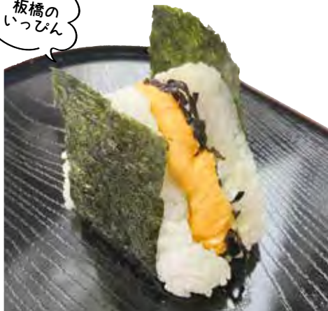
玉子焼きと塩昆布マヨ