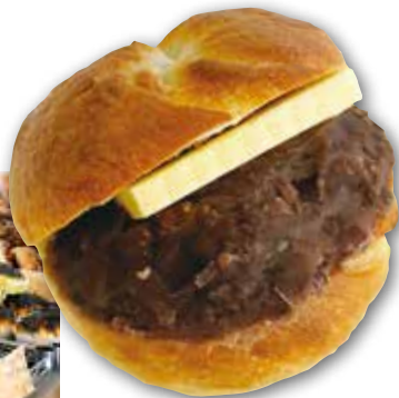
あんバターベーグル