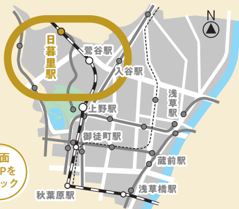
表紙: 谷中銀座商店街