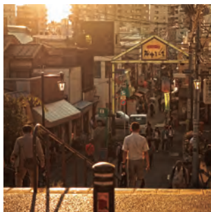
日暮里駅西口を進むと、懐かしい 雰囲気のお店街が。夕やけだん だんからの撮影がおすすめ。 谷中銀座商店街