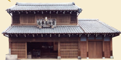
下町風俗資料館付設展示場 旧吉田屋酒店 📍上野桜木2-10-6