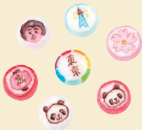
D. 表情いろいろ ポップで愛らしい金太郎飴

【写真協力】 A. イリヤプラスカフェ B. パティシエ ショコラティエ イナムラショウゾウ C. ひみつ堂 D. 金太郎飴本店 E. 竹隆庵岡壁 本店 F. 入谷鬼子母神門前のだや G. カヤバ珈琲 H. TAYORI I. DEN J. 浄名院 K. 菊寿堂いせ辰 L. すし乃池