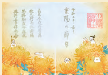
小野照崎神社 ♡下谷2-13-14 小野篁公を祀 る神社。季節ご との御朱印は ホームページで 確認を。