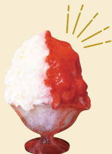
C. “かわいい”が詰まった 至福のおやつタイムを