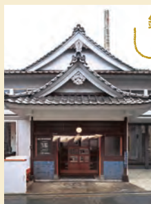
撮影：上野則宏 協力：SCAI THE BATHHOUSE