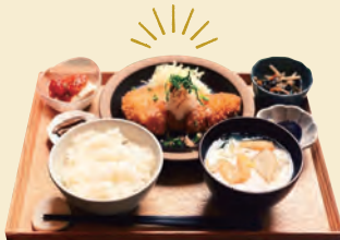
H. 路地裏の古民家カフェで ほっと落ち着くごはん