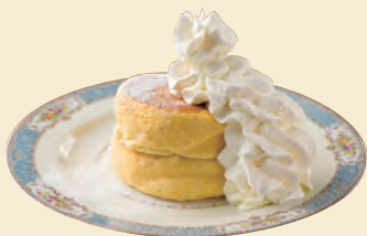
A. リノベーションカフェで 時間を忘れてのんびり