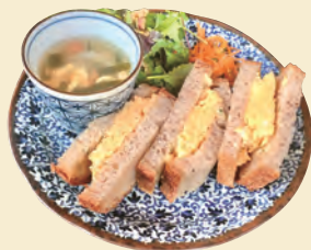
G. 朝さんぼのあとは 町家でモーニング