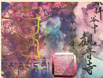
観音寺 ♡谷中5-8-28 築地塀のある 観音寺の御 朱印は華やか なデザイン。

多くのお寺が集まり、寺町として発展してきた谷中。近年は、デザインやイラストなどの入った御朱印を授ける寺社も。日付が入るので、街歩きの記事にもなります。