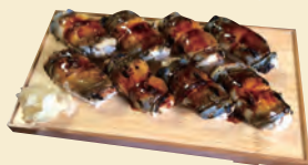
L. 人情味溢れるお店の おもてなしにほっこり