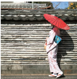
土と瓦を交互に積み重ねた土塀 に屋根瓦をふいた築地塀は、国 指定の登録有形文化財です。 観音寺 ♡谷中5-8-28