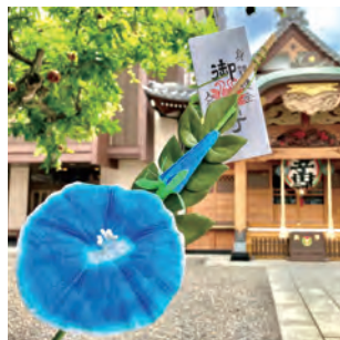
毎年7月に開催される朝顔まつり の時期には、朝顔のお守りを授 かることができます。 入谷鬼子母神(真源寺) ♡下谷1-12-16