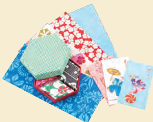
K. 色鮮やかな千代紙の 美しさに惹かれて