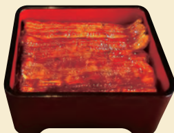
F. 職人の技が光る 絶品の鰻をいただく