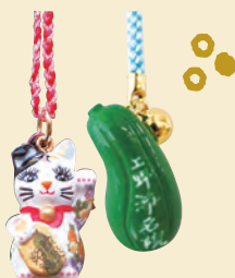
J. 情緒あふれる寺町で お守りを授かる