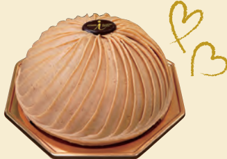
B. スイーツ天国の谷中で 評判の名品を求めて