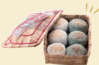
E. おさんぽ途中で発見 下町で愛される銘菓