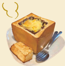
I. 老舗喫茶店の 看板メニューで満腹