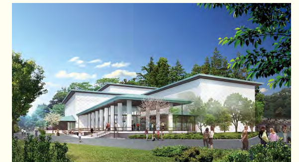
2026년 전체 개관 예상도

황실에 전해 내려온 문화재를 다음 세대에 물려주고 황실과 문화의 관계를 소개하는 거점으로서 보다 많은 분께 친숙한 존재가 되도록 앞으로도 최선을 다하겠습니다.