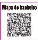
Mapa do banheiro