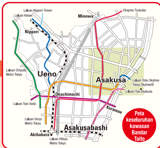
Peta keseluruhan kawasan Bandar Taito

Dikenali dengan suasana pekan lama dan tokong bersejarah Buddha, Asakusa merupakan daerah yang paling tradisional di Tokyo. Bahagian yang paling menarik di Asakusa adalah bahagian tengah beberapa blok yang di sekeliling Tokong Asakusa Kannon yang berusia berabad-abad atau Sensoji, yang menjadi daya tarikan utama kawasan ini. Datang dan rasai tarikan zaman lama yang merupakan pusat perniagaan dan hiburan masyarakat pada zaman Edo dan nikmati kehidupan tempatan yang meriah pada masa kini dan dahulu.