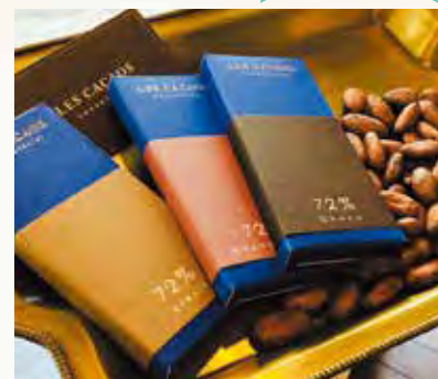
タブレットショコラ (各種 980円・税込)