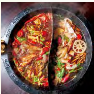
火鍋 (2種スープセット) (テイクアウト用2人前 5000円・税込)

中国栄養膳師の資格を持つオーナーシェフ 孤田欣也氏が手がける本場四川風の火鍋専門店。群馬県産ブランド肉「加藤ポーク」を始め、全国から取り寄せた旬の野菜や魚介を、オリジナル薬膳スープで味わえるヘルシーさも魅力。