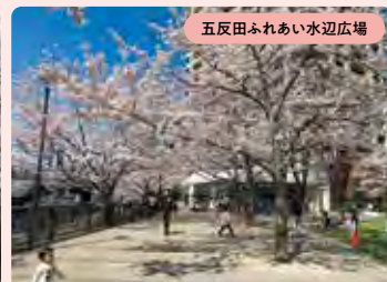
五反田ふれあい水辺広場