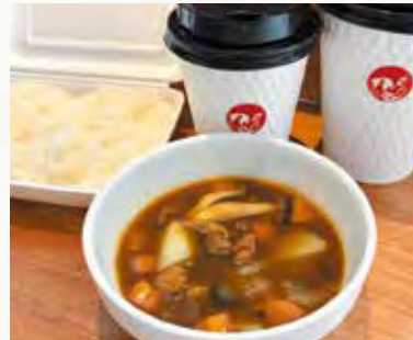
鶏だしチキンスープカレー (Rサイズ320円、ごはんセット+150円・税込)

五反田で創業70年の鶏肉専門店が手がける、鶏だし専門店。お料理用の鶏だしだけでなく、スープカレーや週替りポタージュ、日替わりスープ、鶏おこわごはん、パンのセットなど、調理したスープ・お惣菜も販売している。