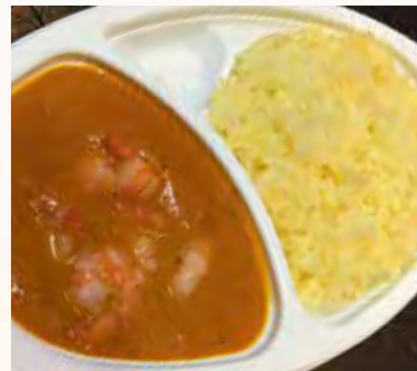
ブロンマッカヌアラ (650円・税込)

本場インドの5つ星ホテルで辣腕を振るった、シェフの味を堪能できる本格的インドレストラン。テイクアウト(ランチのみ)メニューは日替わり3種類から1つをチョイス。それに焼ききたてナンカターメリックライスがつく。