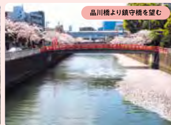
品川橋より鎮守橋を望む

四季折々の風情が楽しめる目黒から品川にかけてのエリアの中でも、春の目黒川沿道の桜は格別。目黒エリアでは約4kmに約800本、品川エリアでは約3kmに約700本の桜が咲き誇る。船入場橋から上流は川幅が狭く、水面を覆いつくす桜が圧巻。船入場橋より下流から品川エリアは、川幅も広く遊歩道も整備され、のんびりと花見が楽しめる。遊覧船でのツアーも人気を集めている。