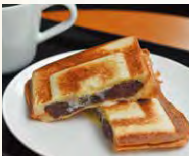
ホットサンド あんバター (528円・税込・イートイン)

五反田駅より徒歩3分、こだわりのコーヒー、カフェラテ、紅茶、インターネットが使える快適なカフェ。ドロップインスタイルのテレワークもできるスペースを完備(有料)。テラス席ではペットの同伴も可能。喫煙ブースあり。