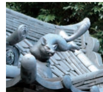
本殿の屋根に置かれた狐像の留蓋(とめぶた)

稲荷神とされる宇迦之御霊神(うがのみたまのかみ)を祀る三囲神社の境内には狐にまつわるものが、多。本殿の屋根の隅隅には1匹ずつ狐の像が置かれ、区の登録文化財に指定されている石造常夜燈の中台(ちゆうだい)にも狐と宝珠が刻まれている。享和2(1802)年に三井家が奉納した一対の神狐は、目尻が下がった様子から「三囲のおごんごんさん」と親しまれている。