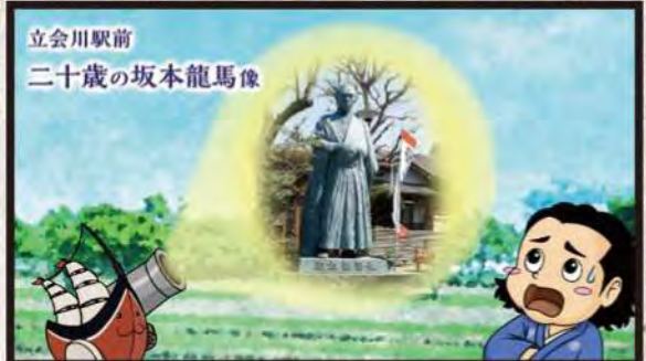
立会川駅前 二十歳の坂本龍馬像