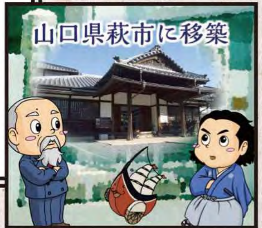
山口県萩市に移築