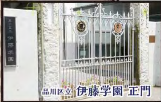
品川区立 伊藤学園 正門

9 伊藤博文の別邸は品川にありました。 今では取り壊され、一部は 山口県に移築されましたが、 別邸の門は、伊藤学園の正門として 残されています。学校の名前も そのまま伊藤博文の 伊藤を使っています。