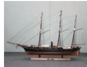
墨田区役所内に展示されている咸臨丸の模型