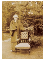
晩年の勝海舟。本名は義邦、通称は麟太郎

慶応4(1868)年には西郷隆盛と会見し、江戸城の無血開城に成功。江戸市民を戦禍から救った。明治政府でも多くの要職を歴任し、伯爵に叙せられた。「海軍歴史」「開国起源」など多くの著書を残している。