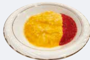
C. まるでタイムスリップ 昭和レトロな純喫茶