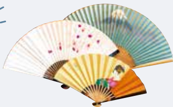
E. 歴史ある街ならではの 粋な逸品はいかが