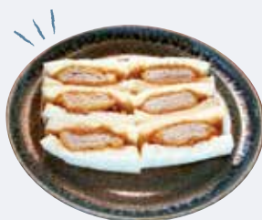
K. 蔵前に隣接する鳥越は 食通も注目のエリア