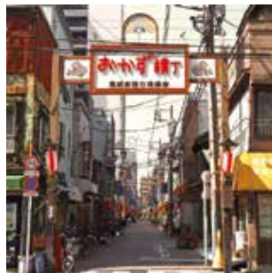
惣菜店が軒を連ね、地元住民の胃袋を支えてきたことから、「おかず横丁」として親しまれてきました。