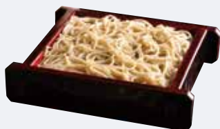
J. 江戸っ子の大好物 そばを老舗で味わう