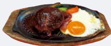
L. 地元で愛される 洋食の味に舌鼓