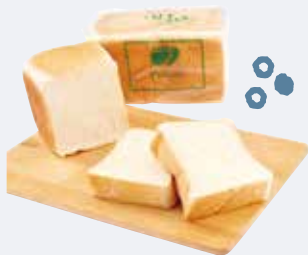
A. 売切必至 ロングセラーをおみやげに