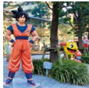
玩具メーカーが集まる街で、人気キャラクター像を見つけよう。