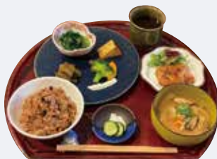
B. 健康的なご飯を食べて 心も身体も大満足