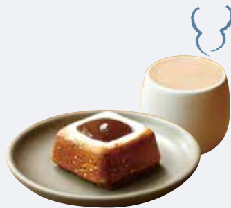
I. 素材にこだわった 専門店の味わいを堪能