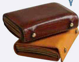
F. クリエイターが集う蔵前で 自分だけの一点モノを