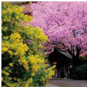
相撲と縁の深い蔵前神社。桜とミモザのコラボレーションは、うっとりするほどの美しさ。