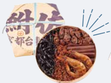
D. 受け継がれる 元祖の味をお持ち帰り

【写真協力】A. ベリカン B. 結わえる本店 C. ゆうらく D. 耐佐 E. 松根屋 F. エムピウ G. 梅花亭 H. デイリースマフィン蔵前 I. ダンデライオン・チョコレート ファクトリー&カフェ蔵前©Dandelion Chocolate Japan J. 江戸蕎麦手打庵あさだ K. 鳥越まめぞ L. 洋食大吉