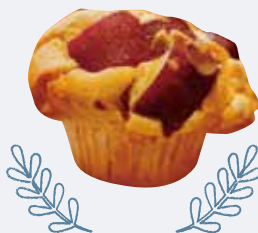
H. 甘い香りに引き寄せられて 蔵前さんぽで素敵な発見