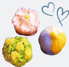
G. 江戸の風情が残る かわいい和菓子