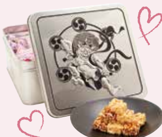
K. 世代を超えて愛される 浅草銘菓をおみやげに