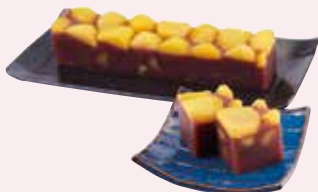
E. 江戸から続く 伝統の味をお持ち帰り