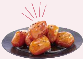
D. 浅草観光のお供に ほっとする懐かしい味

【写真協力】 A. 善々喜園 B. 菓子工房ルスルス 浅草店 C. ふなわかふえ 浅草店 D. おいもやさん興伸 E. 龍昇亭西むら F. 浅草今半 国際通り本店 G. 製菓川喜多 H. 雷門 三定 I. 木村家本店 J. 弁天山美家古寿司 K. 常盤堂雷おこし本舗 L. どぜう飯田屋