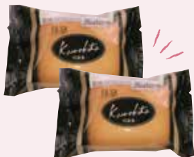
G. ちょっと足を延ばした 奥浅草にも名店がズラリ