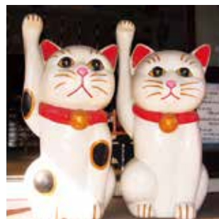
今戸神社は縁結びの神社として知られており、招き猫の発祥の地ともいわれています。 今戸神社 📍今戸1-5-22