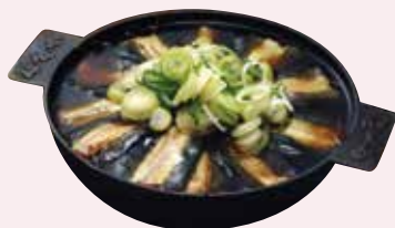
L. 江戸っ子が親しむ どじょう料理に舌鼓