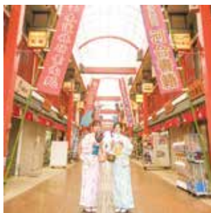
浅草寺境内と浅草六区を結ぶ西参道は風情があり、着物映えが叶うフォトスポット。 浅草西参道商店街