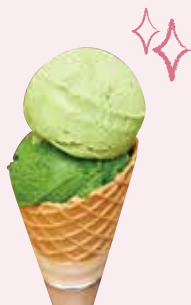
A. 抹茶好きにはたまらない 激戦区エリアを巡る