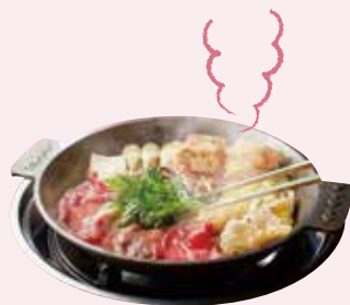
F. 文明開化の味がする 極上のすき焼き