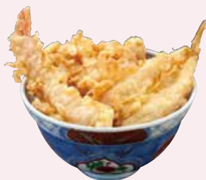
H. 浅草に来たら外せない 名物の天丼をご賞味あれ