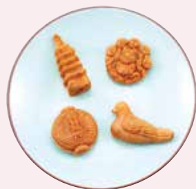
I. 浅草の名所をモチーフにした 人形焼を食べ比べ