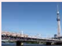
すみだりパーウォーク®