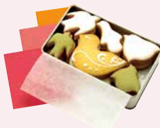
B. 可愛いおやつを 素敵なギフトに