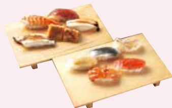
J. 歴史あるまちで 粋な江戸前寿司を