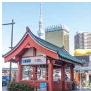
昭和2年に開業した地下鉄銀座線は、東洋初の地下鉄。浅草駅の4番出口は当時の外観のまま。 東京メトロ銀座線 浅草駅 4番出口