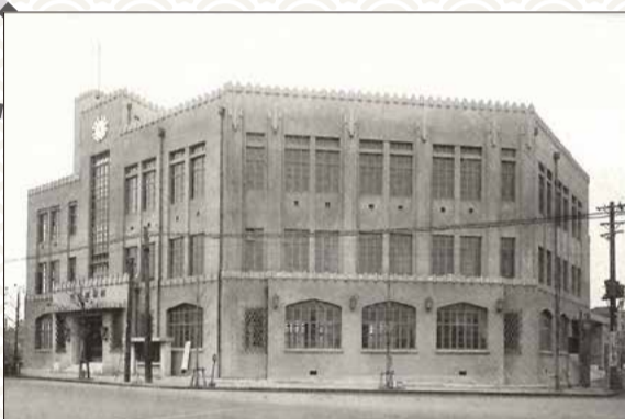
品川区役所（昭和9年竣工時／竣工記念冊子より）