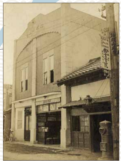
品川郵便局（右）と海老原商店・明治火災保険品川代理店