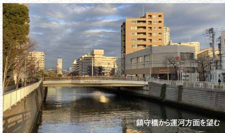
鎮守橋から運河方面を望む