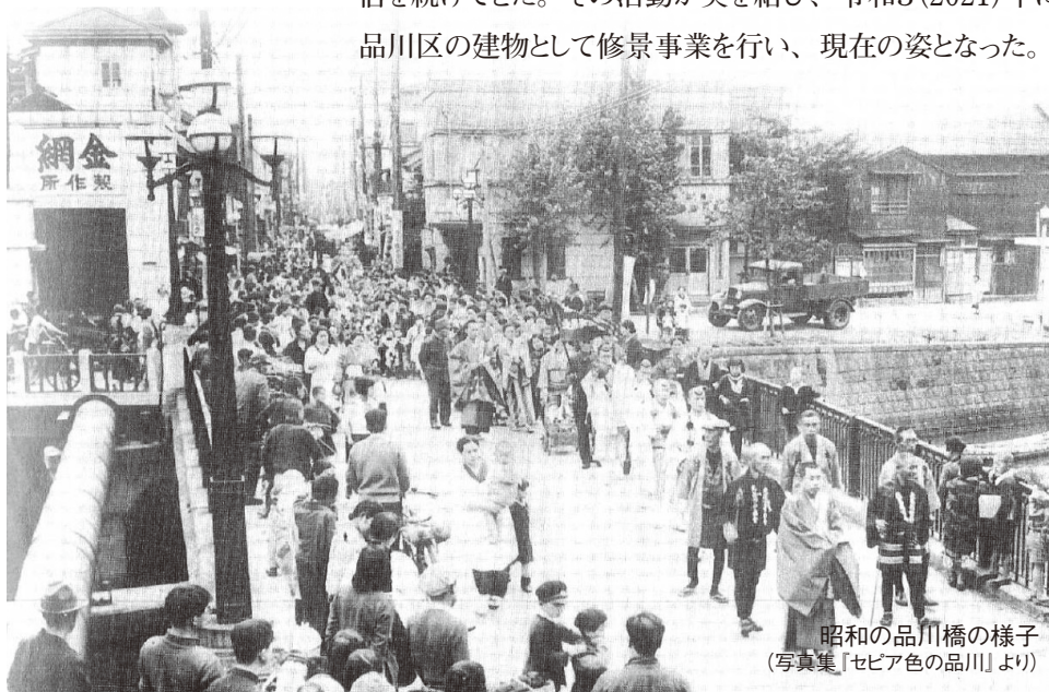
昭和の品川橋の様子 (写真集『セピア色の品川』より)