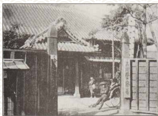
昭和2年、目黒川改修工事で移転。写真は移転前（明治時代）、品川橋南詰の頃の品川警察署（明治43年発行『東京名所図会』より）