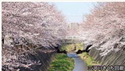
三沢川さくら回廊