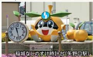
稲城なしのすけ時計台(矢野口駅)