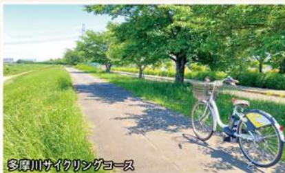
多摩川サイクリングコース