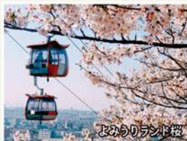
よみうりランド桜