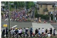
オリンピックテストイベント