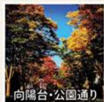
向陽台・公園通り