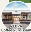
ZEBRA Coffee & Croissant