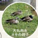
大丸用水 カモの親子

稲城市の農業には欠かせない用水。梅雨時は 紫陽花も美しく、カモの親子に出会えるかも?