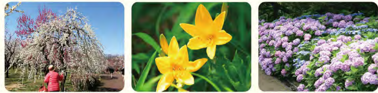
ウメ ムサシノキスゲ アジサイ