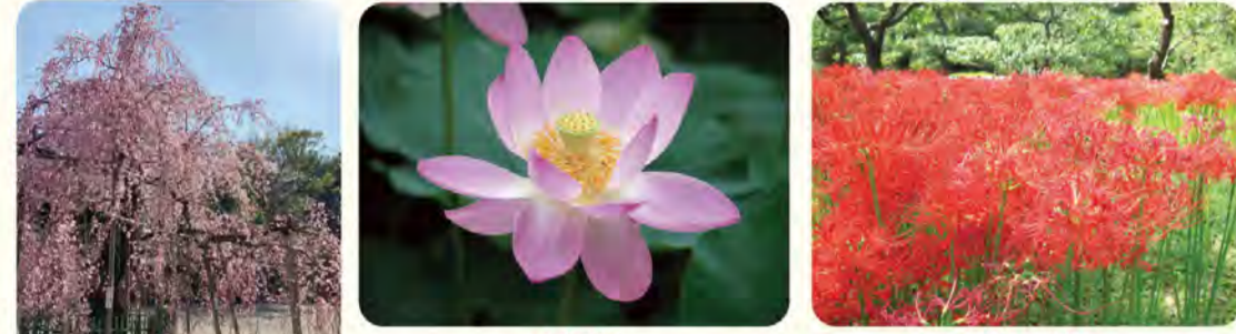
枝垂れ桜 大賀蓮 ヒガンバナ