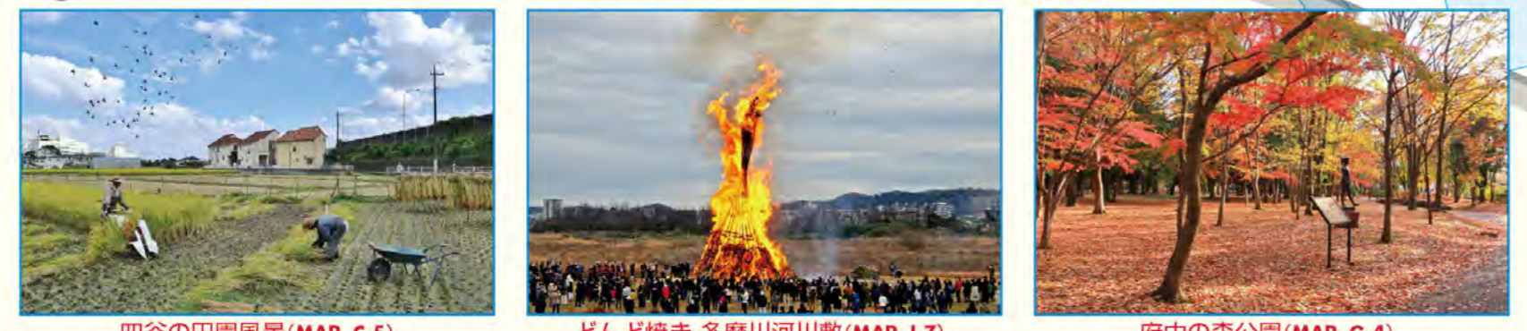
四谷の田園風景 (MAP C-5) どんど焼き 多摩川河川敷 (MAP I-7) 府中の森公園 (MAP G-4)