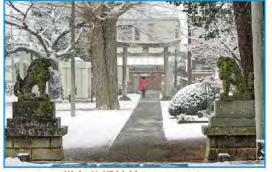
常久八幡神社 (MAP H-5)