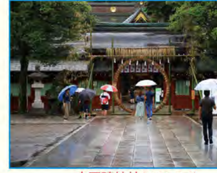
大園神社 (MAP F-5)