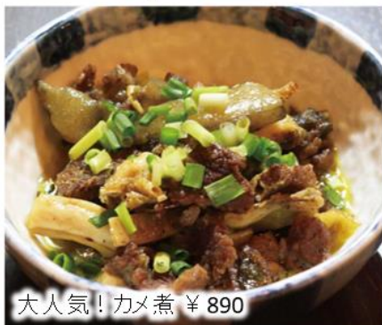
大人気! カメ煮 ¥ 890