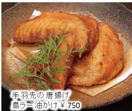
手羽先の唐揚げ 島ラー油がけ ¥750