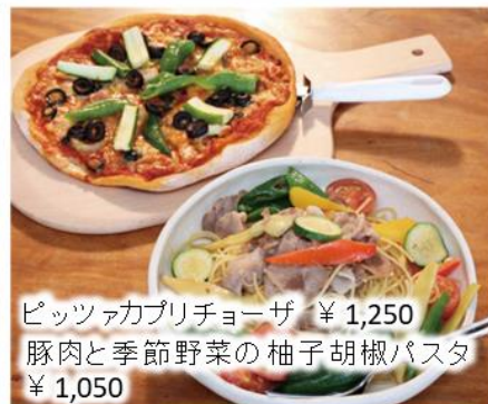
ピッツァカプリチーザ ¥1,250 豚肉と季節野菜の柚子胡椒パスタ ¥1,050

🍽️ お食事 ¥1,000～/1人 🎉 ご宴会 ¥5,000～/1人 🍹 ドリンク ¥500～