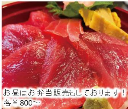
お昼はお弁当販売もしております！ 各¥800～