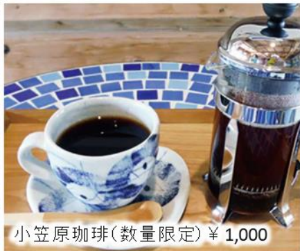
小笠原珈琲(数量限定) ¥1,000