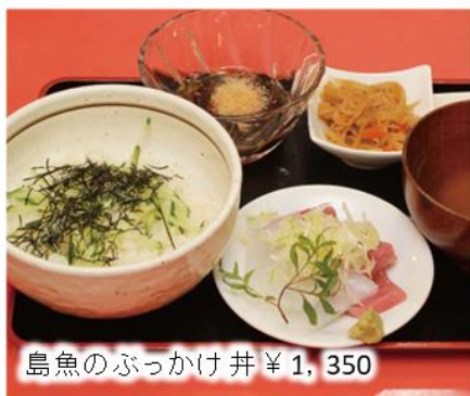
島魚のぶっかけ丼 ¥1,350