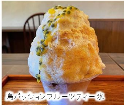
島パッションフルーツティー氷