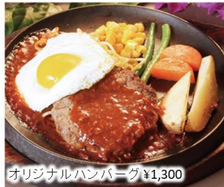
オリジナルハンバーグ ¥1,300