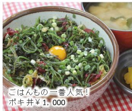
ごはんもの一番人気！ ポキ丼 ¥1,000