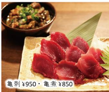
亀刺 ¥950・亀煮 ¥850