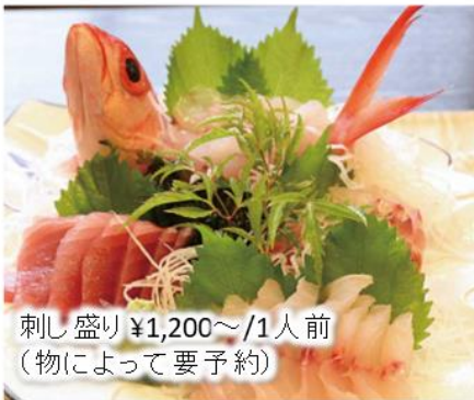
刺し盛り ¥1,200 ~ /1人前 (物によって要予約)