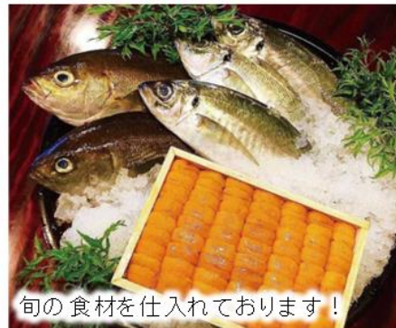
旬の食材を仕入れております！

🍽️ お食事 ¥2,500～/1人 🎉 ご宴会 ¥4,000～¥6,000/1人 🍹 ドリンク ¥700～