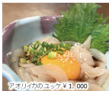
アオリイカのユッケ ¥1,000