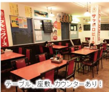
テーブル、座敷、カウンターあり！