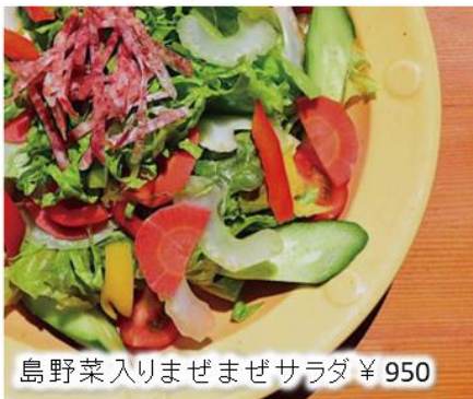
島野菜入りまぜまぜサラダ ¥950