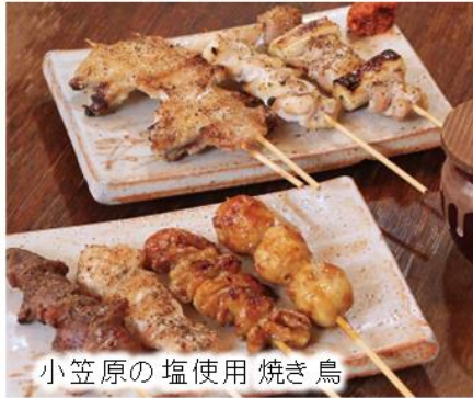
小笠原の塩使用 焼き鳥