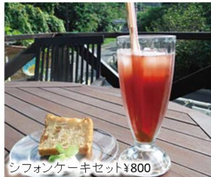
シフォンケーキセット ¥800