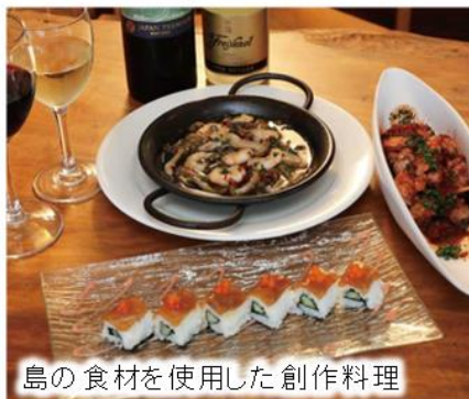
島の食材を使用した創作料理