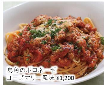
島魚のポロネーゼ ローズマリー風味 ¥1,200