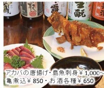
アカバの唐揚げ・島魚刺身 ¥1,000 ~ 亀煮込 ¥850 ・お酒各種 ¥650