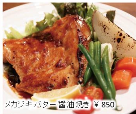
メカジキバター醤油焼き ¥ 850

🍽️ お食事 ¥2,000 ~ /1人 🍽️ ご宴会 ¥3,000 ~ /1人 🍷 ドリンク ¥500 ~