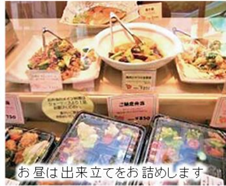
お昼は出来立てをお詰めします