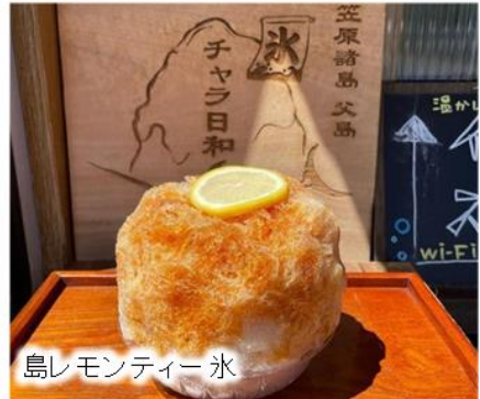
島レモンティー氷