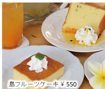
島フルーツケーキ ¥550