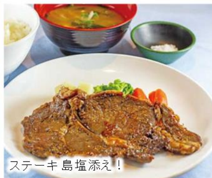
ステーキ 島塩添え!