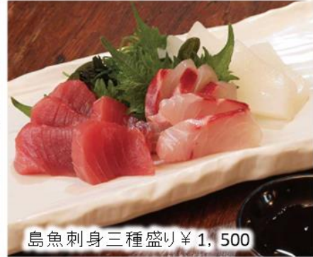
島魚刺身三種盛り ¥1,500