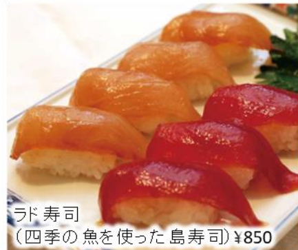
ラド寿司 (四季の魚を使った島寿司) ¥850