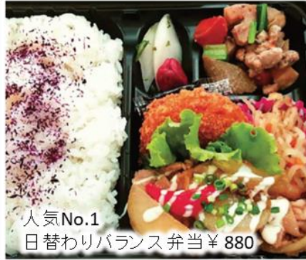
人気No.1 日替わりバランス弁当 ¥880