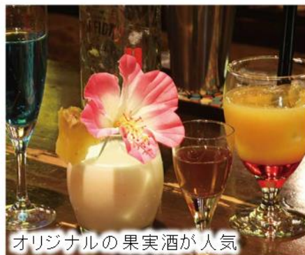
オリジナルの果実酒が人気

¥ お食事 ¥1,000 ~ /1人 ご宴会 ¥3,500 ~ /1人 ドリンク ¥500 ~