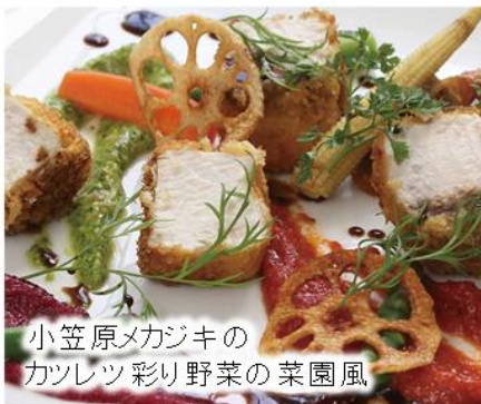
小笠原メカジキの カツレット 彩り野菜の 菜園風