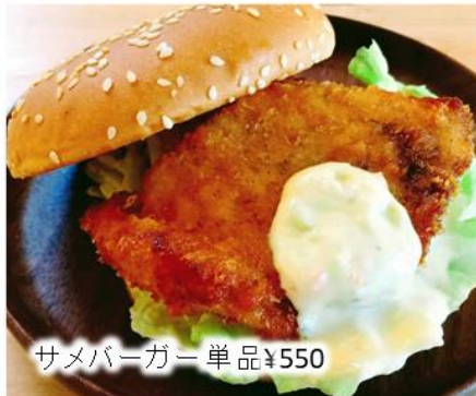
サメバーガー 単品 ¥550