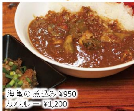
海亀の煮込み ¥950 カメカレー ¥1,200

🍽️ お食事 ¥1,000 ~ /1人 🍽️ ご宴会 ¥2,000 ~ /1人 🍷 ドリンク ¥600 ~