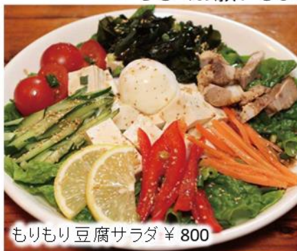
もりもり豆腐サラダ ¥ 800