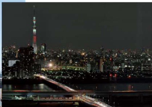
展望室からの眺望