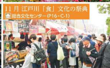
11月 江戸川「食」文化の祭典