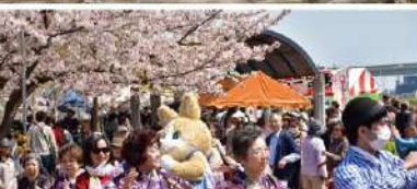
4月 区内各地 さくらまつり