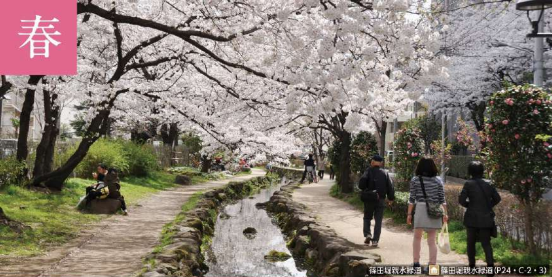
篠田堀親水緑道 ④ 篠田堀親水緑道 (P24・C-2・3)