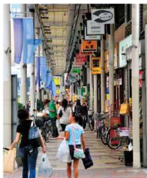
フラワーロード商店街