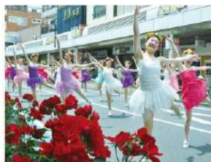
フラワーまつり (5月下旬)