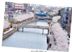
火の見櫓からの眺望