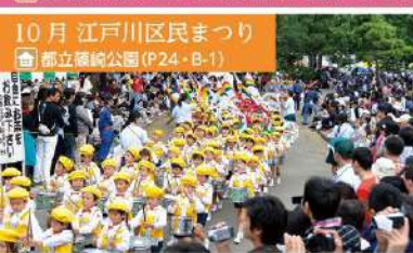
10月 江戸川区民まつり