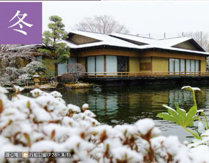
源心庵 行船公園(P28・A-1)