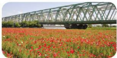
荒川河川敷 (平井大橋付近)