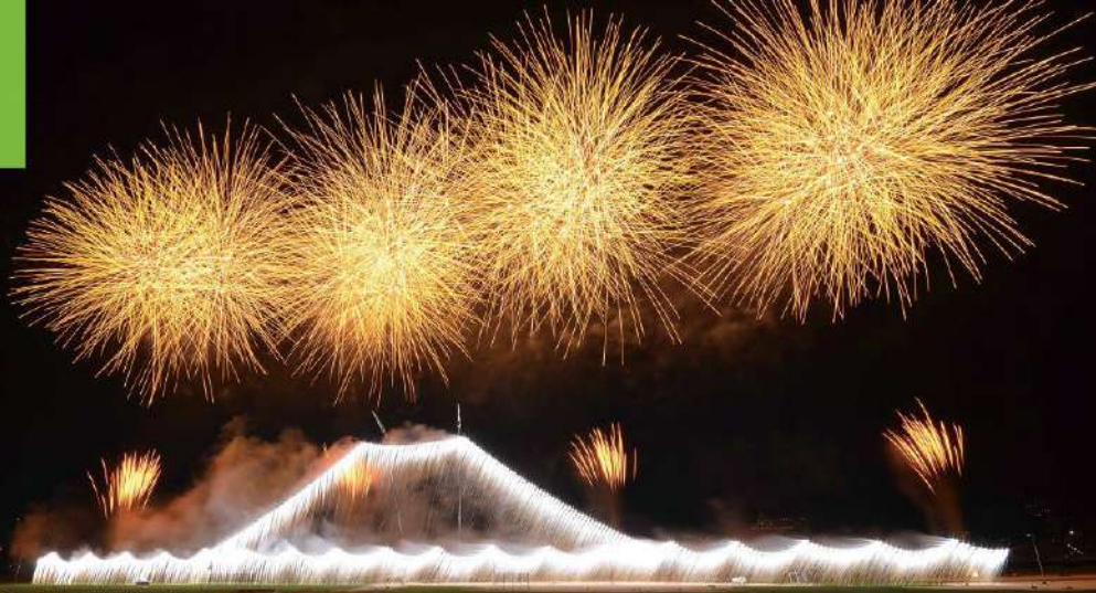
江戸川区花火大会 江戸川河川敷(P24・B-1)