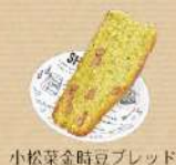
小松菜金時豆ブレッド