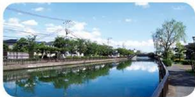
新川沿いの散策路