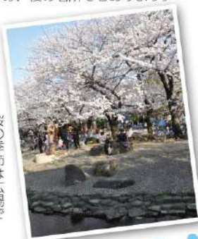
桜の季節は広場で花見ができます