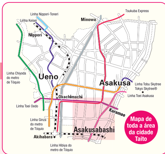
Mapa de toda a área da cidade Taito

A área de Kuramae até Asakusabashi tem prosperado desde o período Edo como um centro comercial e de tráfego, explorando a riqueza natural do rio Sumida. O Shogunato Tokugawa construiu aqui uma passagem denominada "Asakusa-Mitsuke" como um posto de guarda avançado e crucial para a defesa do Castelo Edo. Hoje, com a sua densa comunidade comercial composta por comércio por grosso e retalhista como as lojas de bonecas tradicionais, Asakusabashi atrai numerosos visitantes.