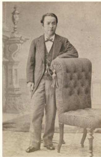
43歳の栄一[1883(明治16)年]

33歳で官僚を辞め、実業界に踏み出すと、目覚ましい活躍を続け、1931(昭和6)年、その生涯を閉じました(91歳)。