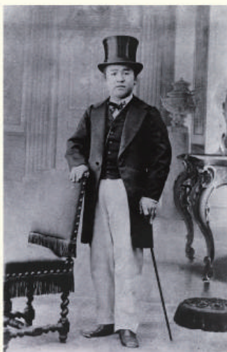
フランス時代の栄一

1840(天保11)年、現在の埼玉県深谷市の農家に生まれた栄一は、24歳で一橋慶喜(15代将軍徳川慶喜)に仕官。27歳でフランスへ渡航、欧州の先進技術、社会経済制度などを学びました。帰国後、29歳で明治政府民部省へ出仕し、貨幣制度、銀行制度の立案などに関わりました。