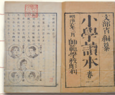
国定以前の教科書 1873(明治6)年