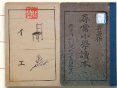
国定時代の教科書 国定1期(明治37-42年)