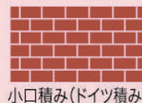
小口積み(ドイツ積み)