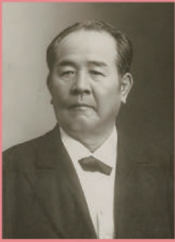
渋沢栄一 (1840~1931)

1 万円札に描かれた人物は、これまで〈聖徳太子〉と〈福沢諭吉〉の二人だけでしたが、2024(令和6)年度上期からの新一万円札の肖像は"日本資本主義の父"とも称される〈渋沢栄一〉になります。