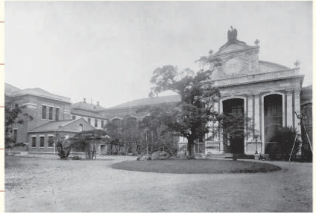
明治時代の国立印刷局

1871 (明治4)年、大蔵省紙幣司(現国立印刷局)が創設され、栄一は初代紙幣頭(長官)に就任します。当時の紙幣は、印刷技術が未熟だったため、ドイツやアメリカに製造を依頼していましたが、明治政府は国産化へと舵を切り、現在まで国立印刷局が製造