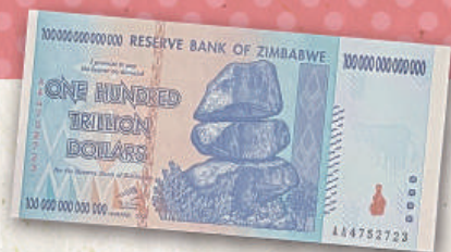
『経済混乱時のジンバブエ100兆ドル』

ここは世界のお札が150種類以上並ぶ博物館。一、十、百、千、万……ひゃ、100兆!? これ本物? 詳しくは博物館で調べてみよう!