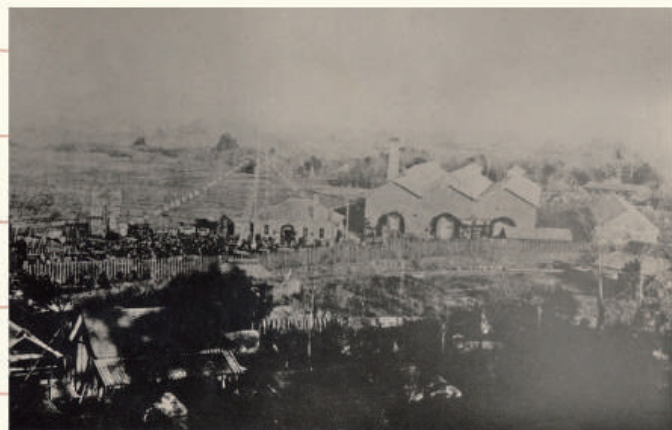
抄紙会社開業式

フランスから帰国後、栄一は日本を近代化するため、知識や情報を共有する新聞などの印刷物の普及が重要だと考え、抄紙 しょうし 会社の設立を主導し、①物流に最適な石神井川の水運、②製紙工程に必要な千川用水の良質な水、③原料のボロ布の集積地・紙