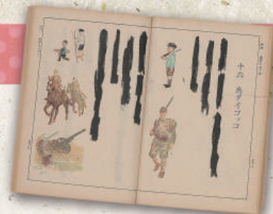
墨塗り教科書『ヨミカタ 二』

ここにはいろんな時代の教科書が展示されてるよ。 おや？ 文章が黒く塗りつぶされているのは何故？ 東書文庫に行って館長に聞いてみよう！