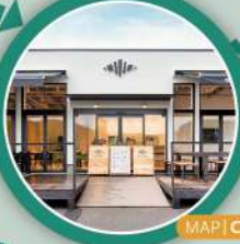
MAP | C-3

デザイン性の高いお洒落な店舗では、くじら橋を見ながら良質なコーヒーとクロワッサンが味わえる。 (電話) 050-3749-3202