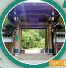
MAP | D-3

全国でも珍しい神仏混交の寺院。毎年8月7日には、東京都無形民俗文化財に指定されている「蛇より行事」が行われる。この行事は妙見尊が青龍に乗ってこの地に現れたという言い伝えによるもので、カヤをよって作られる大蛇は全長100〜150メートルにもなり、この蛇に触れると災難や病氣から免れるといわれている。