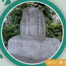
MAP | D-3

永禄元年(1558年)比叡山で修行した僧侶が再興した天台宗の寺院で、東京都指定文化財の木造阿弥陀如来及び両脇侍像(もくぞうあみだによらいおよりわきざう)と閻魔王坐像(えんまおうざざう)が安置されている。木造阿弥陀如来及び両脇侍像は市内で最も古い仏像として知られている。また、阿弥陀堂(あみだどう)の鏡天井には、江戸時代後期に描かれた飛天図及び龍図が残っており、稲城市指定文化財に指定されている。室内の拝観は電話等による事前予約が必要。 (電話) 042-377-7660