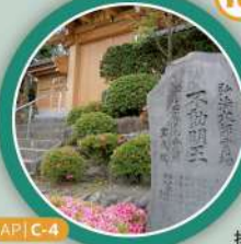
MAP | C-4

明治6年から明治42年まで立志小学校の校舎として使われ、教育界に大きく貢献した寺院。関東大震災後の慰霊として建立された地藏菩薩は、戦時中に疎開していた児童を守ったと伝えられ、今でも多くの人々に崇拝されている。