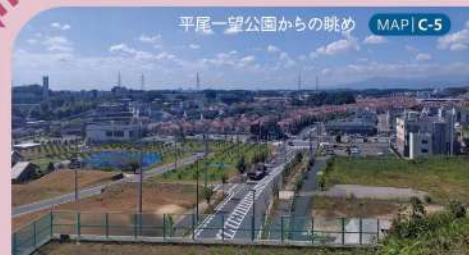
平尾一望公園からの眺め MAP|C-5