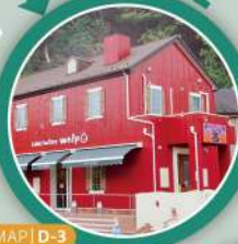
MAP | D-3

特産品の梨やぶどうを使ったお菓子等、いろいろなお土産を作っているケーキ屋さん。 (電話) 0120-512-154