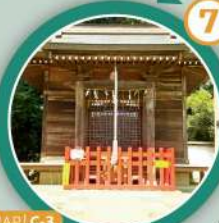
MAP | C-3

神社が位置する百村の登台は、いにしえより落雷がたびたびあったことから、大雷神を祀ったといわれている。創建時期は明らかではないが、神社の中には慶応4年(1868年)に作成されたキリシタン禁止令等の太政官高札(掟などを知らせるために立てた板札)が保管されている。