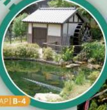
MAP | B-4

上谷戸川周辺の昔ながらの景観を保存・復元し、自然観察や水遊びができる環境に整備した親水公園。動植物の生息空間に配慮しており、6月上旬には「上谷戸ホテルの会」が丹精こめて育てたホテルを観賞できる。また、公園周辺は市の鳥として認定した「チョウゲンボウ」の繁殖地となっており、優雅な姿を眺めることもできる。