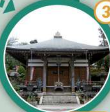
MAP | D-3