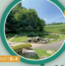
MAP | B-4

野球、サッカーができる多目的広場やテニスコート、休日にはパーベキューなどを楽しむ人で賑わうピクニック広場がある。テニスコートの地下には、東京都の施設である若葉台給水所があり、約2,000トンの水を確保し、災害時にはここから水を供給することができる。