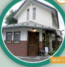
MAP | B-4

ケーキや焼き菓子が豊富な若葉台の住宅街に佇む洋菓子店。 (電話) 042-331-6613