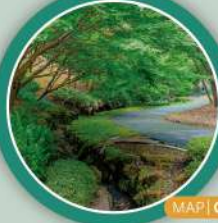
MAP | C-3

総合グラウンドや総合体育館、野球場などの運動施設、芝生広場、デザインがユニークなくじら橋などがある。公園内には武蔵野の自然林が残されており、散策路は市民の散歩や健康づくりに利用されている。また、綺麗に手入れされた花壇も見ごたえがある。 (体育施設の開館時間) 9:00 ~ 21:30 (体育施設の休館日) 第2・4月曜(休日の場合はその翌日)