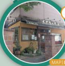
MAP | D-3

日替わりランチが人気! 稲城駅近くにあるアットホームな洋食屋さん。 (電話) 042-379-2250