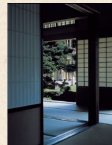
部材のひとつひとつに、現在では入手困難な木材が使われている。