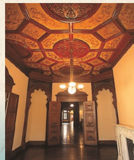
1階婦人客室天井はシルクの日本刺繍の布張りになっている。