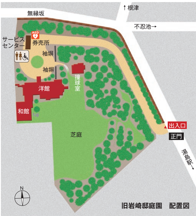
旧岩崎邸庭園 配置図