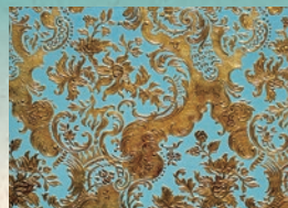
2階客室の金唐革紙。