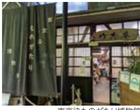
東京染ものがたり博物館

小さな絹の布キレをつまんで作る髪飾り、つまみかんざし。伝統に粋でモダンな感性を織り込んだ東京染小紋や江戸更紗。日本建築の伝統技法である木組み。日本の伝統技術にふれることができるミニ博物館3館。工房見学や体験講座なども行っています(要問合せ)。