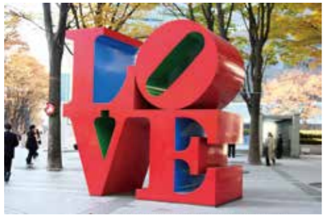
13 «LOVE» (Autor: Robert Indiana)

El arte público puede ser apreciado fácilmente por todo el mundo ya que se ubica en un espacio público al aire libre. Alrededor de la estación de Shinjuku hay gran cantidad de arte público. Estas obras de arte público son muy populares entre la gente como lugar de encuentro, así como lugar para fotografiar y filmar.