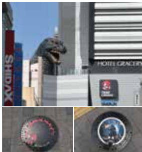
TM & © TOHO CO., LTD.

La cabeza de Godzilla (Godzilla Head) se encuentra en la terraza del octavo piso del edificio Shinjuku Toho, el cual se inauguró en el antiguo terreno del Teatro Shinjuku Koma. La cabeza de este personaje de ficción se encuentra a una altura de unos 50 metros, la cual es la misma altura que tenía Godzilla en la primera obra que se estrenó en 1954. Además, en la acera cerca de la entrada del edificio Shinjuku Toho, se pueden apreciar dos tipos de tapas de alcantarillado diseñadas con motivos de Godzilla.