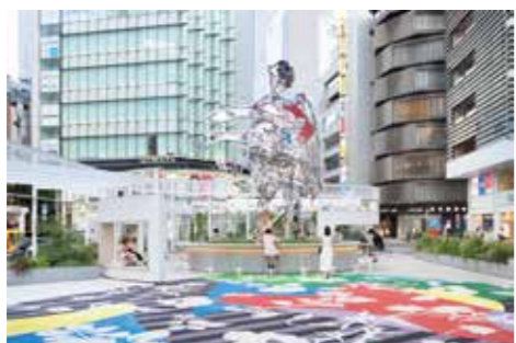
15 «Hanao-san» (Producción y supervisión: Tomokazu Matsuyama)