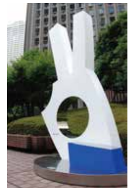
14 «Hand of Peace» (Autor: Keimu Kamata)