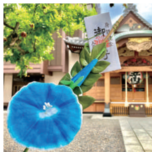
毎年7月に開催される朝顔まつり の時期には、朝顔のお守りを授 かることができます。 入谷鬼子母神(真源寺) ♡下谷1-12-16