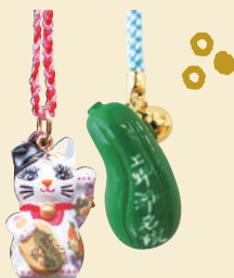
J. 情緒あふれる寺町で お守りを授かる