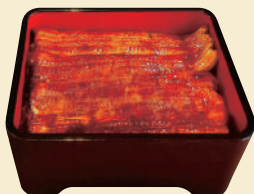
F. 職人の技が光る 絶品の鰻をいただく