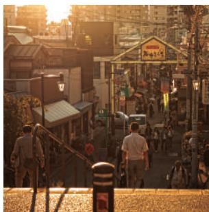
日暮里駅西口を進むと、懐かしい 雰囲気のお店街が。夕やけだん だんからの撮影がおすすめ。 谷中銀座商店街