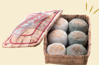
E. おさんぽ途中で発見 下町で愛される銘菓