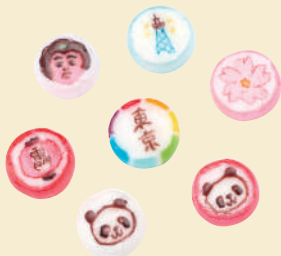
D. 表情いろいろ ポップで愛らしい金太郎飴

【写真協力】 A. イリヤプラスカフェ B. パティシエ ショコラティエ イナムラショウゾウ C. ひみつ堂 D. 金太郎飴本店 E. 竹隆庵岡壁 本店 F. 入谷鬼子母神門前のだや G. カヤバ珈琲 H. TAYORI I. DEN J. 浄名院 K. 菊寿堂いせ辰 L. すし乃池