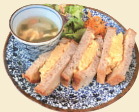
G. 朝さんぼのあとは 町家でモーニング