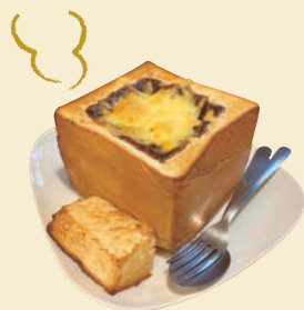
I. 老舗喫茶店の 看板メニューで満腹