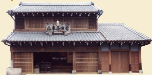
下町風俗資料館付設展示場 旧吉田屋酒店 上野桜木2-10-6