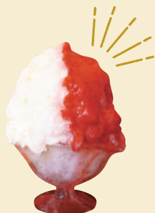
C. “かわいい”が詰まった 至福のおやつタイムを