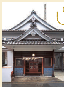
撮影：上野則宏 協力：SCAI THE BATHHOUSE