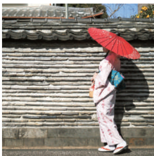
土と瓦を交互に積み重ねた土塀 に屋根瓦をふいた築地塀は、国 指定の登録有形文化財です。 観音寺 ♡谷中5-8-28