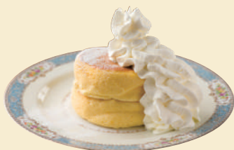
A. リノベーションカフェで 時間を忘れてのんびり