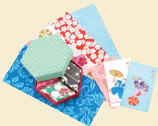
K. 色鮮やかな千代紙の 美しさに惹かれて