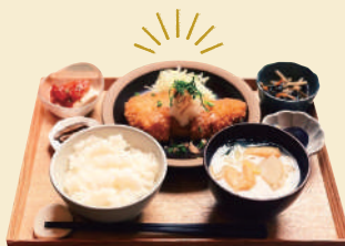
H. 路地裏の古民家カフェで ほっと落ち着くごはん