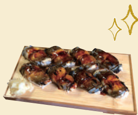
L. 人情味溢れるお店の おもてなしにほっこり