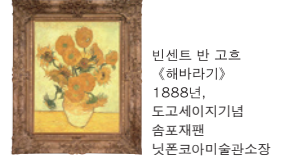
빈센트 반 고흐 <해바라기> 1888년, 도쿄세이지기념 숭포재팬 닷폰코야미술관 소장

신주쿠구 니시신주쿠 2-6-1 신주쿠스미토모빌딩 33층 ☎03-5323-8709 ☎무료 신주쿠역 서쪽출구(JR, 게이오, 오다큐)에서 도보 10분, 니시신주쿠역(지하철)에서 도보 10분, 도초마에역(지하철)에서 도보 1분