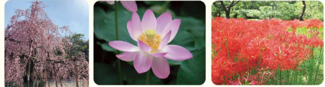
枝垂れ桜 大賀蓮 ヒガンバナ