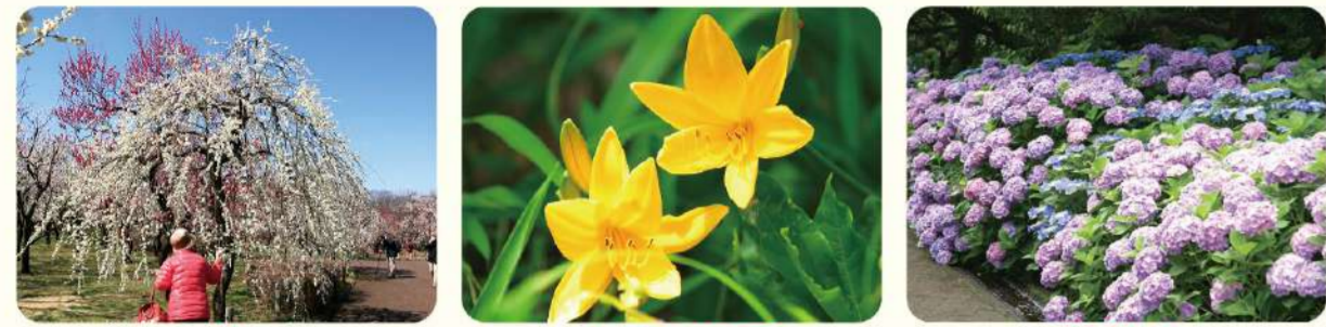
ウメ ムサシノキスゲ アジサイ