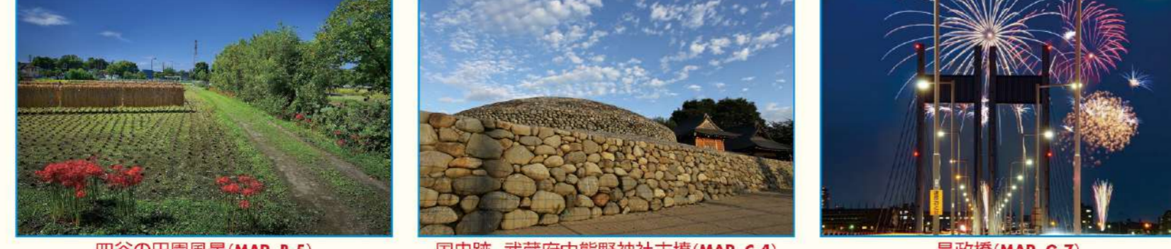
四谷の田園風景 (MAP B-5) 国史跡 武蔵府中熊野神社古墳 (MAP C-4) 是政楼 (MAP G-7) この写真は「わが街自慢写真コンクール」の入選作品です