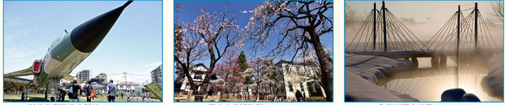
航空自衛隊府中基地 (MAP G-4) 郷士の森博物館 (MAP E-7) 多摩川|観水公園 (MAP H-7) この写真は「わが街自慢写真コンクール」の入選作品です