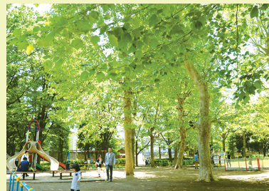
初夏の都立善福寺川緑地

四季折々に楽しめる公園、豪雨に備えたい方のための杉並区の防災の取り組みなどを紹介しています。