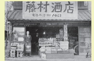
昭和28年の様子を伝える『躍進の杉並』