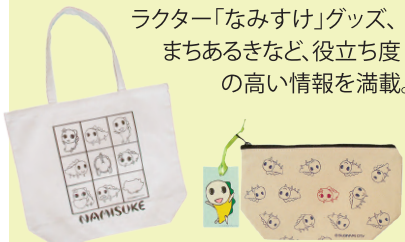
9マスタートバッグ

約80種におよぶ杉並区公式アニメキャラクター「なみすけ」グッズ、まちあるきなど、役立ち度の高い情報を満載。