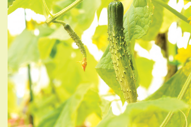
蘇る杉並の在来種・高井戸節成きゅうり

戦禍を乗り越えた老舗、世界で活躍するグローバルカンパニー、数多く集まるアニメ制作会社、都市農業にも注目しています。