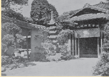
戦前に誕生したジンギスカン専門店ー成吉思汗