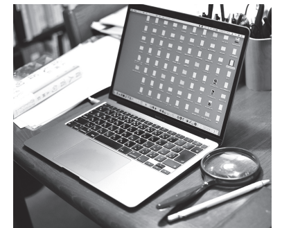
（写真左）アニメ「鉄腕アトム」の主題歌の作詞など、数多くの作品を手掛けた谷川俊太郎さん（写真中）40代の頃の谷川さんと近所に住む生活評論家の吉沢久子さん（写真右）愛用のマックブック