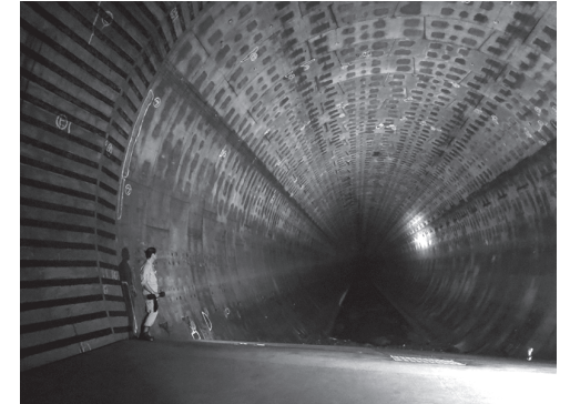
(写真左)2011(平成23)年8月26日の大雨で冠水した阿佐ヶ谷駅付近 (写真右)「神田川・環状七号線地下調節池」本体のトンネル。内径 12.5 m