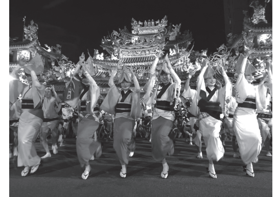
（写真左）「阿佐谷七夕まつり」は例年8月初旬の5日間開催（写真右）2019（平成 31）年の「東京高円寺阿波おどり台湾公演」。台北市の観光スポット「松山慈祐宮（まつやまじゆうぐう）」の周辺で舞い踊った