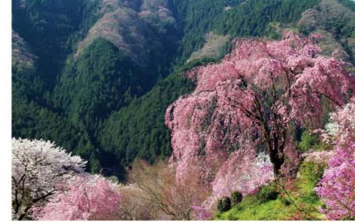
乙津花の里 山間の小さな集落は乙津花の里と呼ばれ、シダレザクラやミツバツツジなどの花で彩られ、ピンク色に染まる美しい春のスポットです。