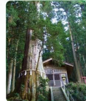
境内の杉は市の天然記念物で、樹齢400年。幹周りは都内一といわれている。