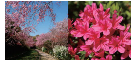
ดอกซากุระ