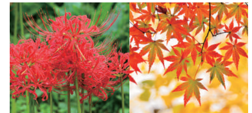
ดอกพลับพลึงแดง