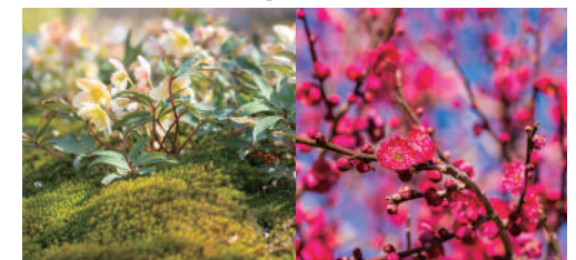
ดอกกุหลาบคริสต์มาส