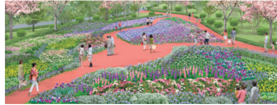
เพลิดเพลินไปกับดอกไม้ตามฤดูกาล!

แปลงดอกไม้กลางแจ้งที่สามารถชมดอกไม้ตามฤดูกาลได้ตลอดทั้งปี ภายในสวนสี่ฤดูมีดอกไม้กว่า 15,000 ต้น และในสวนสนุยกษัตริย์คิวยุจามีดอกไม้กว่า 2,000 ต้น ท่านสามารถเดินชมแปลงดอกไม้บนทางเดินได้อย่างเพลิดเพลินเลยทีเดียว!