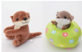
สินค้าจากนกน้อยที่มีเฉพาะที่ HANA·BIYORI!! ราคาตั้งแต่ 500 เยน

ของที่ระลึกที่ได้รับความนิยม! มีสินค้าที่มีจำหน่ายเฉพาะที่นี่มากมาย อาทิ สินค้าน่ารักๆ จากนกน้อย!