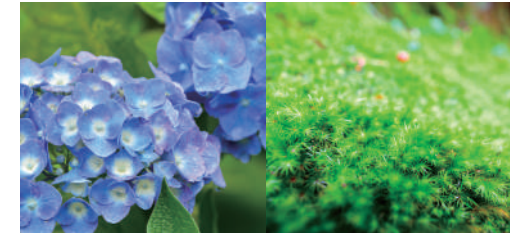
ดอกไฮเดรนเยีย