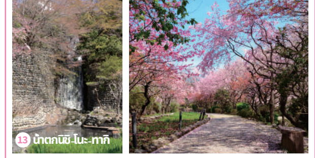
13 น้ำตกนิชิ-โนะ-ทากิ