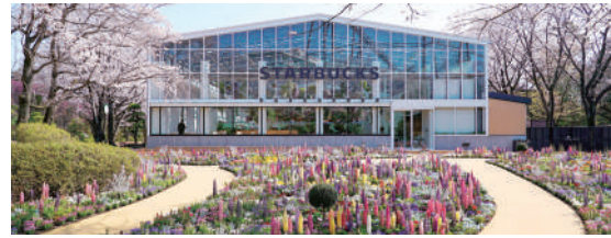
季節の花が楽しめる!

年間通じ、季節の花が楽しめる屋外の花畑。 四季の庭は15,000本、セコイアの庭は2,000本の花々が植えられ、 花壇内を歩きながらお楽しみいただけます。