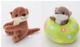
HANA-BIYORI 限定カワウソグッズ!! 250円~