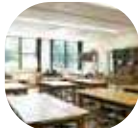
版画制作を楽しめる版画工房とアトリエがあります。

世界でも希少な版画専門美術館。古くは奈良時代から現代に至るまで、世界各地の版画約3万点を収蔵。講演会やコンサートなど、イベントも多く開催されています。