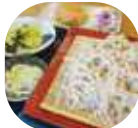
小野路産地粉100%使用、小野路うどん(小鉢付)560円。

江戸時代に宿場町として賑わった小野路宿の旅籠、旧「角屋」を改修し、観光交流の拠点として再整備。風情漂う空間でのんびり過ごしてみては？