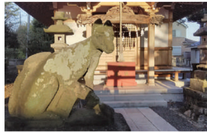
青柳稻荷神社 国立市青柳 236 [A-4]

这里是与立川市接壤的边境处的一个小绿洲,有湿地树木,野生鸟类也会在此栖息。绿地内涌出的地下水汇集于向南方流淌的矢川。