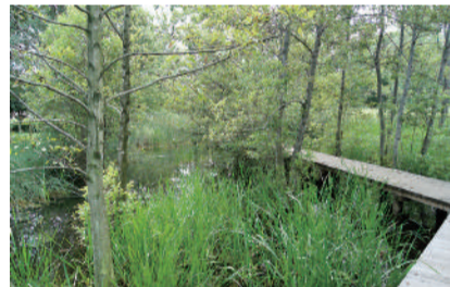
矢川绿地(东京都指定保护地域) 矢川市羽衣町 3 丁目 [A-3/B-3]

为了让残疾人随时可以感受体育的乐趣,在这里设有泳池、体育馆等设施,并举办各类教程。此外还有人人都是可以参与的夏日祭等活动。