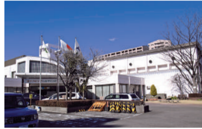
东京都多摩残疾人体育中心 [D-3] 国立市富士见台 2-1-2 ☎042-573-3811

在这所社会科学系国立大学,培养出了多位产业界的领导人。受关东大地震影响后由神田迁移至国立。