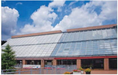
国立市民艺术馆 [C-3] 国立市富士见台 2-48-1 ☎042-574-1515

从 2015 年开始的两年一次的艺术节。在大学道有 6 座 2015 年户外雕刻展览的获奖作品。