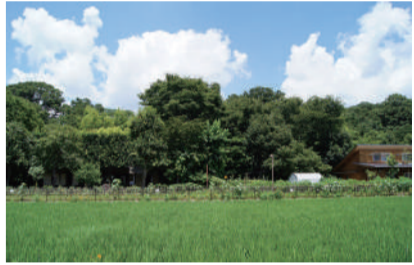
水稻体验田 国立市泉 5-21-2 [C-4]

这是在城山公园内的一处围绕国立市农业的信息发布站点。在这里有组织活动,可以体验收割,另外,也有场租业务。