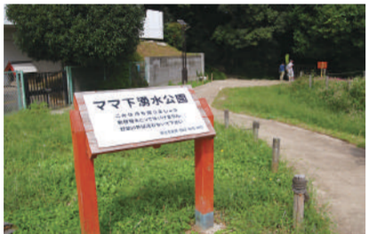
Mama 下涌水公园 国立市矢川 3-12 [B-4]

这是市内的艺术关联设施,包括可以容纳 336 人的大厅和可以容纳 70 人的工作室,此外还有音乐练习室、画廊等。它的隔壁是综合体育馆。