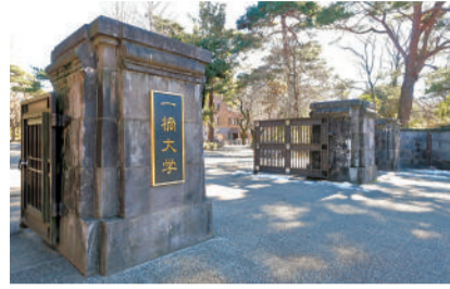
一桥大学 [D-2] *进入校区前请在接待处获得许可。

在春天的大学道,你可以漫步于盛开的染井吉野樱之下。在秋天的大学道,你可以观赏银杏的秋叶,感受季节的变化