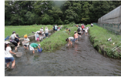
府中灌溉水(农林水产省:全国跳水百选) [B-4/C-4 etc.]

这是中世贵族城堡的遗迹,这里留下了许多武藏野的树林。每年 4 月下旬可以观赏赏樱,8 月下旬可以观赏日本的狐狸剃刀草。