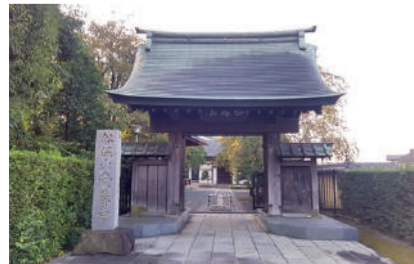
南养寺 国立市谷保 6218 [B-4]

保护这片地域的稻荷神社的守护神是一只石狐。每年都会举行 1 月的祈福火会、2 月的初午、8 月的盆踊、9 月的例行大祭等活动。