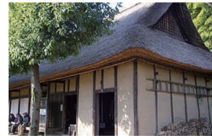
国立市旧民居(市指定文化财产) [C-4] 国立市泉 5-21-20 ☎042-575-3300

这是一座收集了当地的历史、民族、美术、自然等相关资料的博物馆。这是一个远离喧嚣,令人心情放松的空间。此外,还会不定期举办展览。