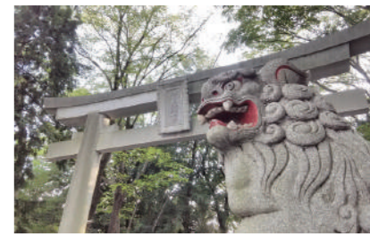
谷保天满宫 国立市谷保 5209 [D-4]

这是东日本最古老的太满宫神社,其中的狛犬等物是国家指定的重要文化财产。在这片安静的树林区域内还有本地雕刻家关敏氏的作品。