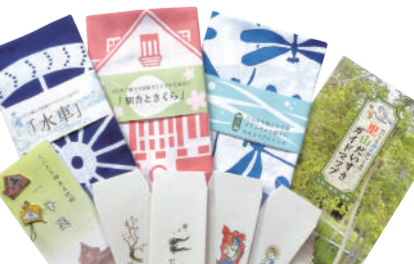
乡土文化馆的商品

在城山公园里,有搬转过来的江户时代的茅草屋顶的民居。屋内展示着壁炉和土间等过去人们生活所用之物。