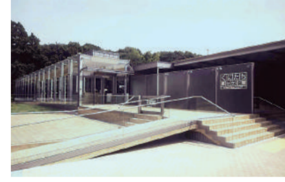
国立乡土文化馆 [B-4] 国立市谷保 6231 ☎042-576-0211

在夏季,流经农田的水像网一般,形成一个宝贵的生态环境。在这里,会有小鱼,还会有稀有昆虫。