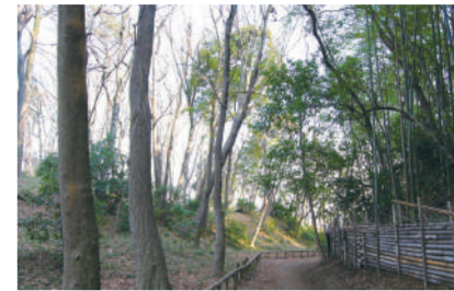
城山公园(东京都历史环境保护区) 国立市谷保 1700 [C-4]

这是东日本最古老的太满宫神社,其中的狛犬等物是国家指定的重要文化财产。在这片安静的树林区域内还有本地雕刻家关敏氏的作品。