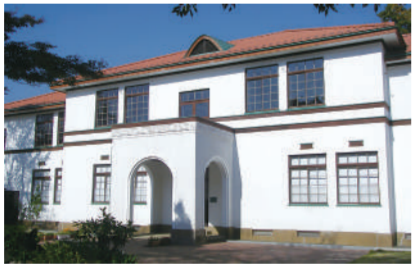
泷乃川学园本馆(国家注册有形文化财产) 国立市谷保 6312 [B-4]

Mama 是当地的方言,意思是悬崖线。这里是南部悬崖线下 10 个涌水处中,水量最大的一个。