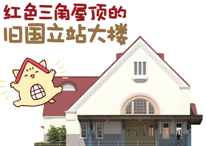
什么是旧国立站大楼?

“旧国立站大楼”是与谷保天满宫齐名的国立地域的标志。从 1926 年(大正 15 年)开业到 2006 年(平成 18 年)为止的 80 年间,它作为这块区域的门户,同时又是很多人会面的场所,为国立市内及市外的人们所熟知。在东京都内,也是仅次于原宿站大楼的最老的木制车站大楼。在 2006 年,它被指定为国立市有形文化财产建筑物。