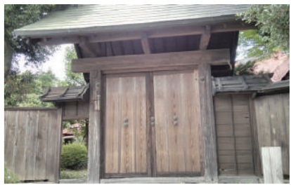
本田家医药门(国家注册文化财产) 国立市谷保 5122 [D-4]

这里除了有各种资料外,还出售具有历史和自然特色的手巾和明信片,另有本市所产的蜂蜜,供您作为礼物之选。