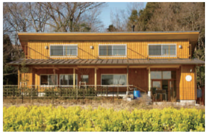
城山之家 [C-4] 国立市泉 5-21-20 ☎042-505-5190

自江户初期以来,本田家族几代人陆续诞生了多位书法家和医生。以这个门的高度,即使骑着马也可以通行。(内部通常不对外开放)。