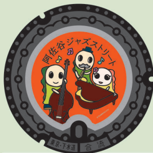
阿佐谷ジャズストリート