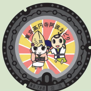
東京高円寺阿波おどり