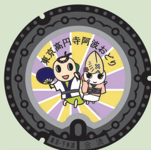
東京高円寺阿波おどり