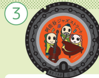
[ 阿佐谷ジャズストリート ]

阿佐谷七まつりでは、地元商店主達が作るその年ごとの流行やアイデアが詰まった伝統のハリボテ飾りや吹き流しが街中を彩り、数多くの出店が並びます!阿佐ヶ谷の街中が笑顔で溢れる七まつりにぜひ遊びにきてください!