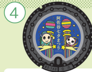
[ 阿佐谷七まつり ]

阿佐谷七まつりでは、地元商店主達が作るその年ごとの流行やアイデアが詰まった伝統のハリボテ飾りや吹き流しが街中を彩り、数多くの出店が並びます!阿佐ヶ谷の街中が笑顔で溢れる七まつりにぜひ遊びにきてください!