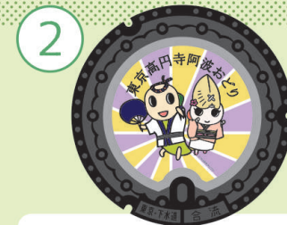
[ 東京高円寺阿波おどり ]

東京高円寺阿波おどりとえば、毎年8月下旬に開催される東京最大級のお祭りです!昭和32年に地元商店街の街おこしとしてスタートした催しは、阿波おどりの本場である徳島からの手ほどきも受けながら、今では、2日間で延べ1万人が踊り、100万人の歓声が響くお祭りとなりました!阿波おどりを通じて、高円寺の街が一体となる2日間にぜひお越しください!