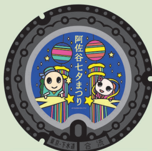
阿佐谷七夕まつり