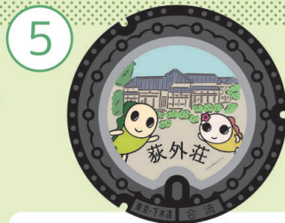
[ 荻外荘 ]

国指定史跡にも選ばれた荻外荘は現在改修の準備中で、令和6年の公開をめざしています!完成を楽しみにしてください!