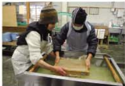
アキルノ野ふるさと工房

「軍道紙」は都の無形文化財です。工房では、うちわづくりや紙すきなどが体験できます。 ※事前にお問合せ下さい。042-596-6000 武蔵五日市駅バス停より「荷田子」下車徒歩約5分