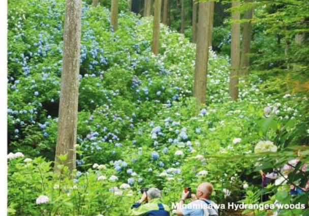
Minamizawa Hydrangea Woods

500mにも渡り、林道沿いにピンクやブルーの鮮やかな紫陽花が約10,000株咲き乱れます。 武蔵五日市駅より徒歩約40分