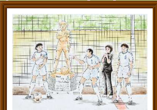
2 四つ木つばさ公園