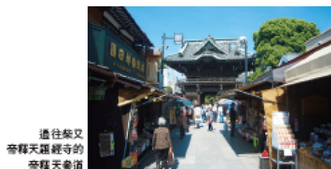
通往柴又 帝釋天題經寺的 帝釋天參道