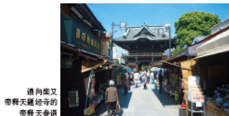
通向柴又 帝释天题经寺的 帝释天参道