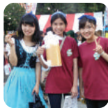
고다이아 옥토버 축제