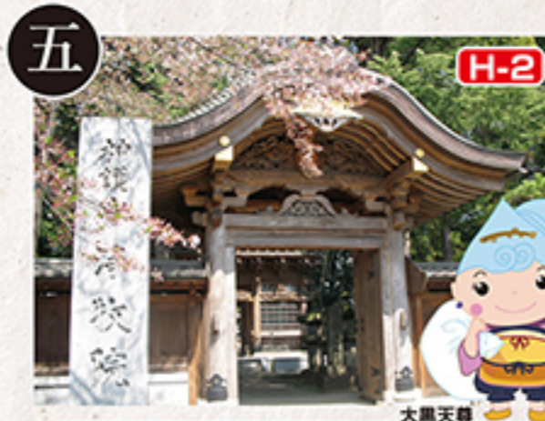
H-2 浄牧院・五百羅漢 大黒天尊

正式には峯龜山洞明院宝泉寺と言われる天台宗の宝泉寺は、桜の大木がそびえ、春には境内全体を包み込みます。石橋六地藏など市指定の文化財を多く所蔵しています。