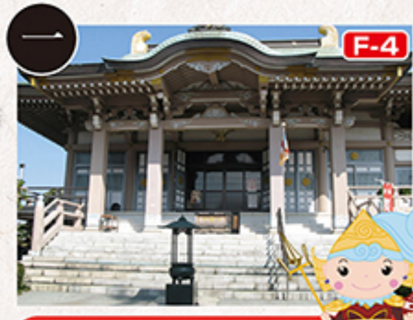
F-4 多聞寺 鹿野門天

真言宗密教派に属する多聞寺は、祐観上人が毘沙門天を本尊とし、学問の神、除災招福の功德尊として信仰を集めています。嘉永6年の造営とされる山門(市指定有形文化財)は総けやき造りの四脚門で、この地方の建築様式の特徴がよく表れています。