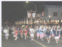
滝山・前沢みんなの夏祭り