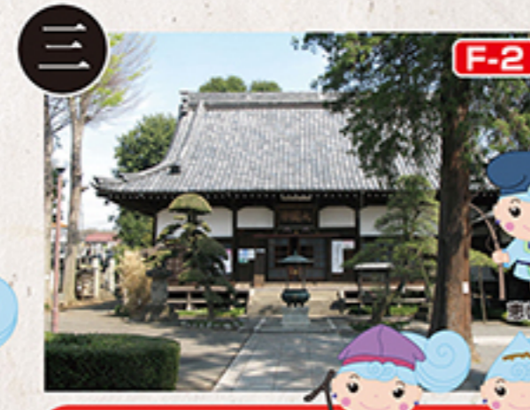
F-2 大圓寺 福徳尊 尚老尊

臨済宗妙心寺派の米津寺は、本尊は千手観世音菩薩、山号を円通山とし、多摩地方で唯一の大名墓所がある寺で、現在の山形県東根市を治めていた米津家の知行地として前沢などがあり、幕末まで続きました。