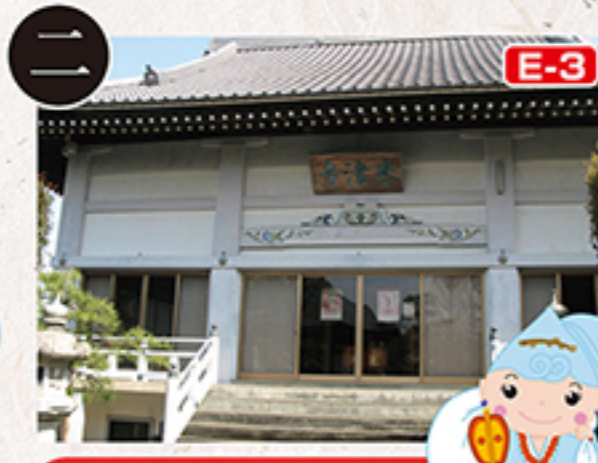
E-3 米津寺 布衣尊

真言宗密教派に属する多聞寺は、祐観上人が毘沙門天を本尊とし、学問の神、除災招福の功德尊として信仰を集めています。嘉永6年の造営とされる山門(市指定有形文化財)は総けやき造りの四脚門で、この地方の建築様式の特徴がよく表れています。