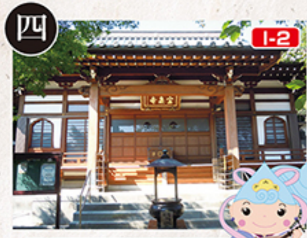
I-2 宝泉寺 弁財天

正式には普門山(山号)三皇院(院号)大圓寺(寺号)という大圓寺は天台宗で、比叡山延暦寺を総本山とします。門前には市内最古の庚申塔(五里五里馬頭)等が並び、寿老尊、福徳尊、恵比寿尊は山門に安置されています。