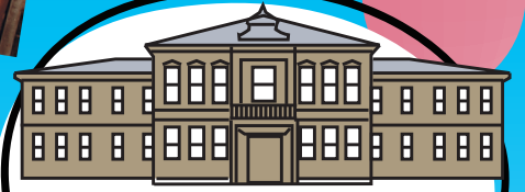
旧東京音楽学校奏楽堂