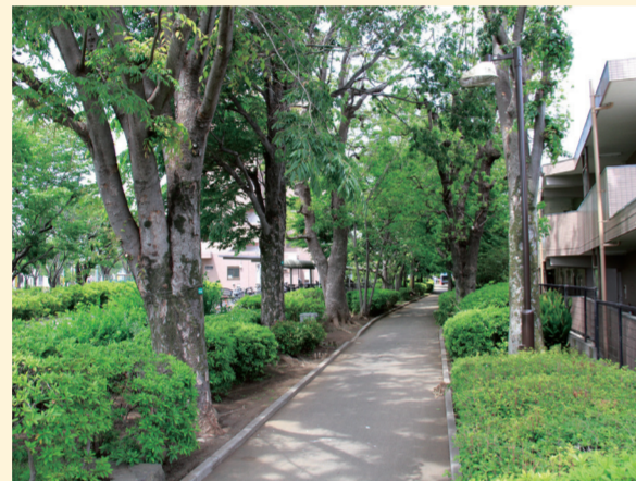
Green Park 漫步游道 01 02

沿中央路向北，自五日市街道至武藏野四入口处，还有市役所北侧街道，道路两旁耸立着市内屈指可数的樱花树。樱花盛开季节，绚丽的樱花通道充满诗情画意。为此每年4月第一个周日都举办樱花节活动。