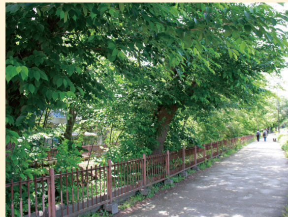
玉川上水 03 04 05 06 04 04 04

武藏野中央公园大致位于武藏野市的中心部位，曾是战前的军用工厂，战后的美军住宅地。根据当地居民的长期愿望，这一地带终于转变成了公园。宽阔的“Harappa”草坪、运动广场，可进行多种多样的活动，为住民提供了愉悦放松的憩息场地。