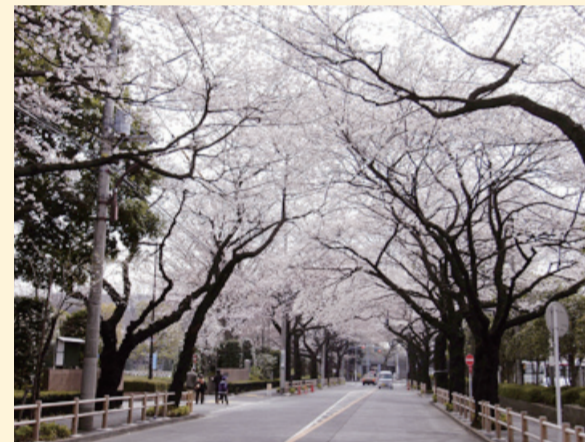
樱花井木(中央路) 01 02 02

1653年玉川上水作为江户市饮用水渠道而修建。上水始于东京都羽村市截止于新宿四谷，全程约43公里长。现在其中部分区间仍然保持原本作用，成为东京都水道局的水道设施的一部分。上水沿途已修建成漫步游道，聆听着潺潺流水，漫步在绿荫小道为现代生活带来了恬静愉悦！